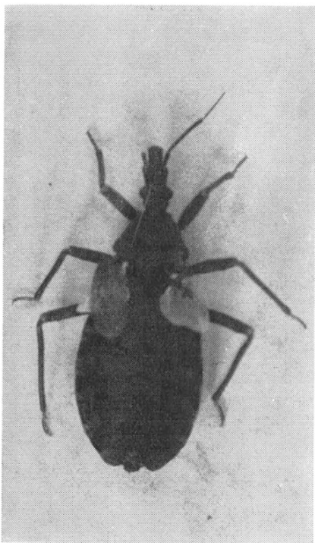
Fig. 2 — T. infestans . Ninfa de 5º estágio, anômala, mostrando grandes aletas e nítida característica do sexo feminino.