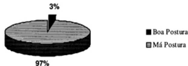
Figura 3- Dados obtidos através das gravações em vídeo tape do procedimento de movimentação de paciente no leito, realizado pelos 17 trabalhadores de enfermagem e analisadas de acordo com as posições assumidas pelos mesmos em relação às posições da coluna, braços e pernas. Ribeirão Preto, 1998.

Através do total de 197,41 minutos de filmagem, referentes a 30 procedimentos filmados onde foi realizada a movimentação de pacientes acamados, durante o procedimento de banho no leito, foi observada a adoção em 5,46 minutos, (2,8% do total observado) de boa postura, aquela por nós categorizada como o conjunto harmônico do dorso ereto, braços flexionados com cotovelo na altura da bancada ou a cinco centímetros dela e pernas flexionadas movimentando ou parada.