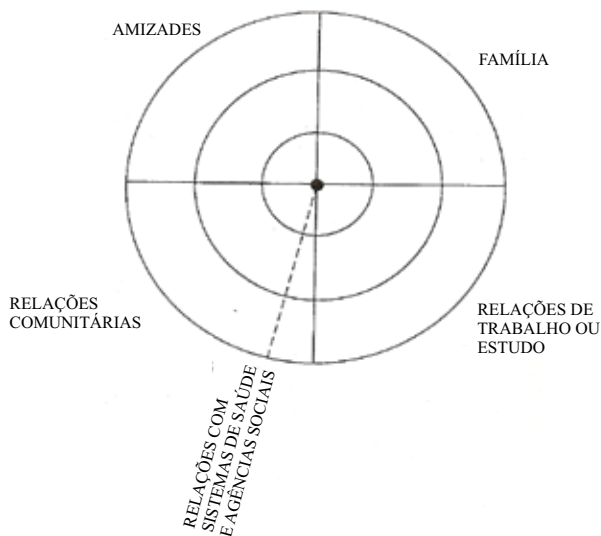
Figura 1 – Mapa Mínimo de Relações proposto por Sluzki (5)

Optou-se pela utilização do Mapa Mínimo de Relações (MMR), porque sua aplicabilidade é acessível a diferentes culturas, situações econômicas, níveis de instrução, e por considerar o significado individual atribuído aos componentes da rede social de apoio (5) . Assim, no terceiro momento, realizou-se a identificação dos membros da rede social de apoio às famílias. Os dados gerados foram agrupados de acordo com o MMR (5) (Figura 1).