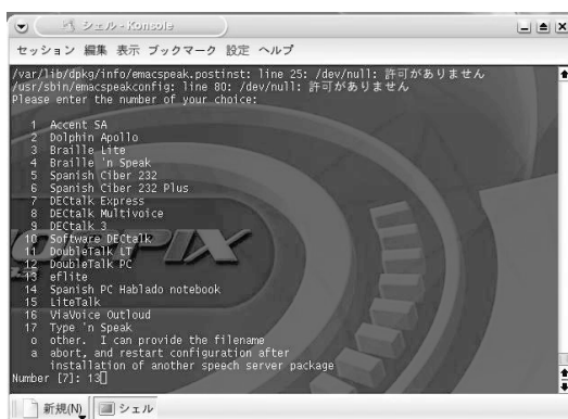
図 3 emacspeak インストール中の画面

iso ファイルシステムを製作するコマンドは mkisofs で、これに複数のオプションをつけて二度起動する。これにより、ファイルの圧縮、そして起動可能な CD とする処理を行う。本試作では、展開された状態で約 1.9G byte のファイル群が 612M byte にまで圧縮された。