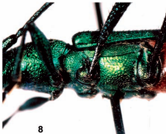
FIGURAS 5-8: 5. Potisangaba panama , pronoto mostrando as áreas de pontuação sexual. 6-8: Metasterno. 6. Chrysoprasis grupiara ; 7. C. principalis ; 8. C. morana .