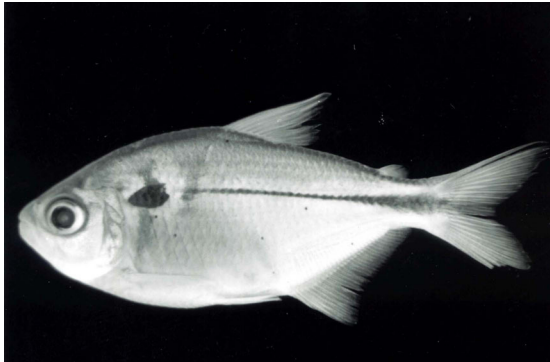
FIGURA 3. Astyanax siapae sp. n. (parátipo AMNH 93173, CP: 62,0 mm).