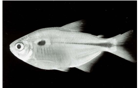
FIGURA 2. Astyanax clavitaeniatus sp. n. (holótipo MZUSP 5146, CP: 48,3 mm).

Parátipos: 22 ex., 33,4-72,4 mm CP. Roraima, Brasil: MZUSP 48281, 11 ex., 33,4-62,5 mm CP e