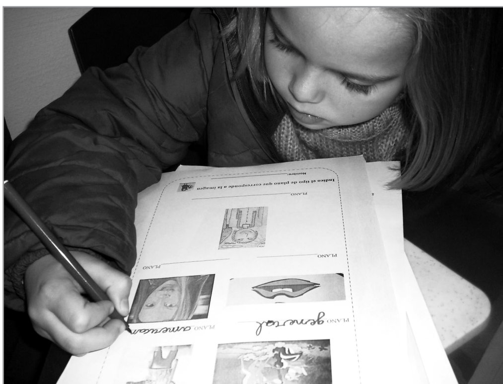
Da Poética de Aristóteles à organização da foto, crianças aprendem a manipular a câmera, a diferenciar elementos básicos da composição da imagem e a contar uma história através da fotografia.

Sem refletir sobre isto, todas as crianças foram capazes de organizar uma história nuclear com um começo, um meio e um final. Também não deu muito trabalho para elas imaginar um plano de imagem fixa que representasse esses três momentos de uma história. Entretanto, as sugestões de movimento e tempo eram frequentes em suas intervenções, sendo preciso lembrá-las a todo momento que em uma fotografia ou em um cartaz não é possível incluir tais noções de tempo e movimento, assim como desejavam fazer. A dificuldade se apresentou no momento de colocar em prática o ordenamento da sequência da história em três