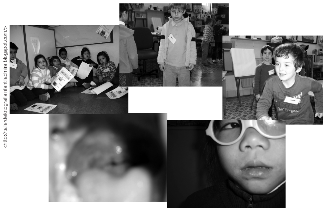
As imagens realizadas pelas crianças em sentido horário: Plano Geral, Plano Americano, Plano Médio, Primeiro Plano e... uma tentativa de Plano Detalhado.

explicação. Como é natural, pretendia-se mostrar a estrutura geral da câmara parte por parte, mas o interesse delas recaía em utilizar o disparador e ver o mundo; muitas tinham se adiantado e já sabiam até como ver a fotografia realizada. Este processo foi proveitoso na medida em que podiam verificar se o plano alcançado era o plano que pretendiam fazer. Logicamente, para aquele momento, os planos principais (geral, americano, médio, primeiro plano e plano detalhe) já tinham um lugar em sua memória. Apesar de esta terminologia ser uma novidade para elas, os exemplos empregados para identificar a taxonomia dos planos surtiram efeito em sua memória. É preciso que sejam imagens ou gráficos que chamem a atenção das crianças e que descrevam explicitamente o significado do plano em questão. O autorretrato é, por outro lado, uma atividade quase cotidiana dos adolescentes na atualidade, seja para colocar na internet, seja para usar no celular; é fácil encontrar imagens de garotos e garotas que se autofotografam, sozinhos ou com amigos. No caso dos menores, essa atividade chamou sugestivamente a atenção, pois não pensavam que eles mesmos pudessem se retratar e, o que é ainda melhor, não sabiam que gesto fazer diante da câmara, pois não tinham a possibilidade de olhar na tela. Foram bastante engenhosos e utilizaram os objetos que refletiam, tais como espelhos, vidros ou elementos metálicos.