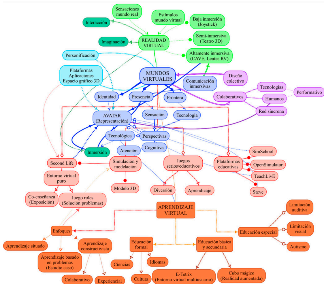
Figura 1 - Entornos de aprendizaje virtual