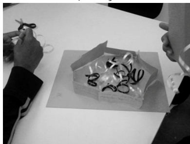
Figura 4- Alunos na produção artística no MUnA.