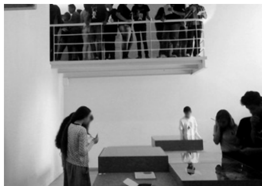
Figura 6- Alunos na exposição de artes no MUnA.