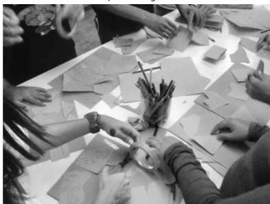
Figura 3- Alunos na produção artística no MUnA.

Nas figuras 3 e 4, é possível observar alguns momentos do processo criativo dos alunos no que se refere aos trabalhos produzidos na oficina de artes do MUnA, durante a ação educativa: