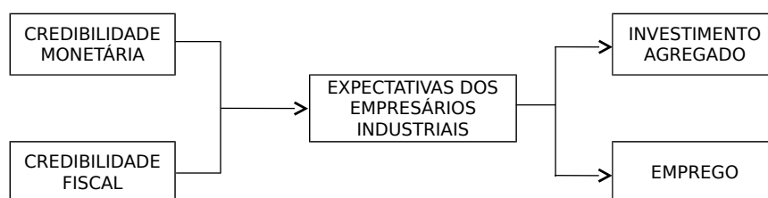
Figura 1: Esquema de análise

A Figura 1 resume a análise feita no trabalho.