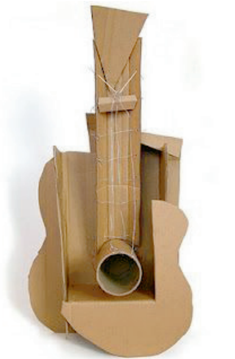
Fig. 2 Pablo Picasso, Guitarra , 1912.

O espaço está lá para ser modelado, dividido, enclausurado, mas não para ser preenchido. A nova escultura tende a abandonar a pedra, o bronze e a argila por materiais industriais como ferro, aço, alumínio, vidro, plástico, celuloide, etc., que são trabalhados com as ferramentas do ferreiro e até do carpinteiro... a nova escultura não é mais esculpida, ela é construída, montada, arranjada, combinada. Com isso o meio adquiriu uma nova flexibilidade 11