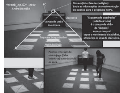
Figura 2. Obra Crack_op-$2 , 2012, de André Damião.

O que a arte-tecnologia tem feito é explorar ao máximo as possibilidades criativas no uso das tecnologias, extraindo o existente nelas, e nesse sentido não há normas e nem verdades, apenas há uma diversidade de visões que enriquecem a capacidade criativa humana.