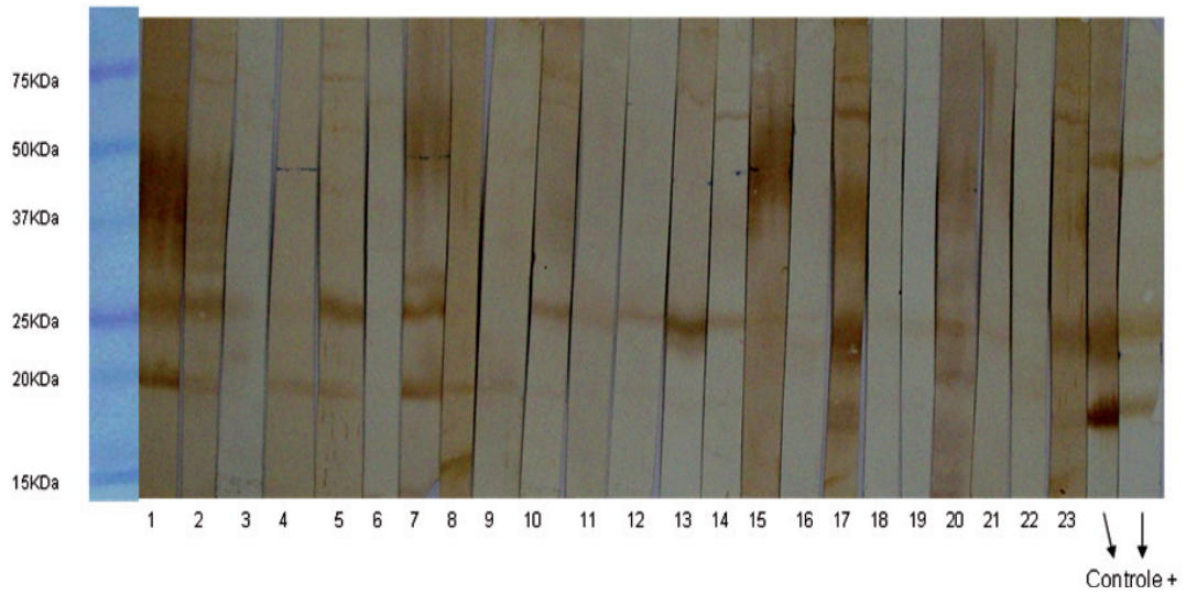
Figura 3 - Imunoblot representativo das amostras dos animais PPD positivos