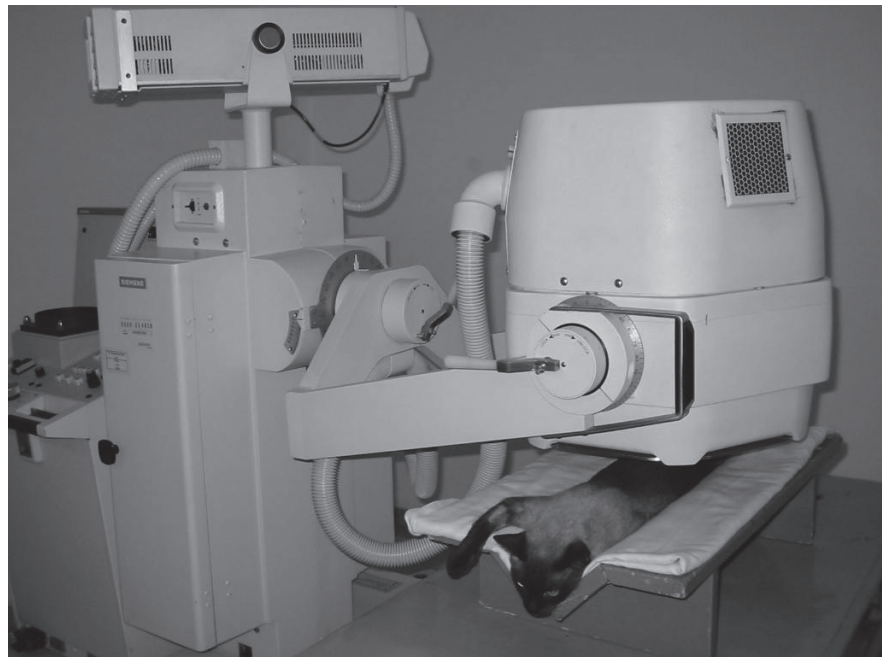
Figura 4- Aparelho de cintilografia (gama-câmara), com felino doméstico sendo submetido ao exame cintilográfico