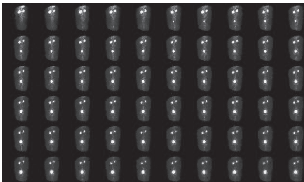
Figura 2- Sequência de imagens de cintilografia renal do felino fêmea do Grupo 2 (anestesiado)