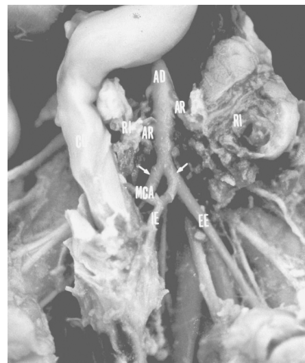
Figura 2 Fotografia da cavidade pleuroabdominal de uma tartaruga, em decúbito dorsal, onde podemos identificar o colo descendente (CD), rim (RI), testículo (TE), aorta direita (AD), artérias testiculares (AT), artérias renais (AR), artéria ilíaca externa direita (æ), artéria ilíaca interna esquerda (IE), artéria mesentérica caudal (MCA), artéria sacral mediana (SM).

irriga o duodeno e pâncreas em 100,00% dos casos. Este vaso anastomosa-se sempre com a artéria pancreaticoduodenal caudal.