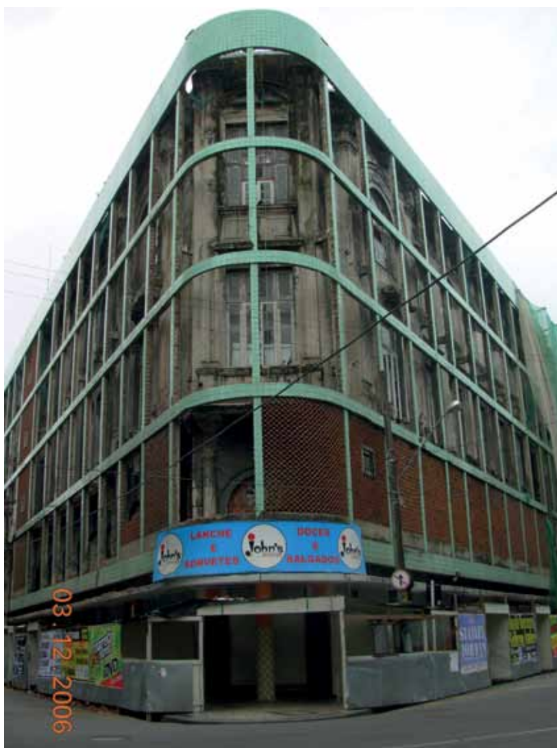
Figura 5 – Edifício Luciano Costa durante o processo de retirada dos cobogós, em 2006.

Em 22 de novembro de 2006, o então superintendente da 5ª SR aprovou os serviços de “demolição das vigas e pilares em concreto armado, externos à fachada da referida edificação” 70 , que se iniciaram nesse mesmo ano (Figura 5). Hoje, uma pequena faixa de cobogós permanece no local, mas apenas devido à dificuldade operacional de retirada, gerada pela proximidade de fios elétricos (Figura 6).