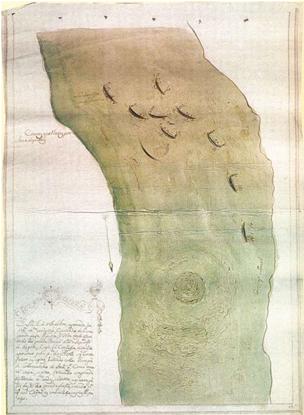
Figura 2 - Teotônio José Juzarte. Este é o célebre e grande Jupiau, muito perigoso, causado de uma grande laje de pedra, que sobe desde o fundo do rio Grande Paraná até a superfície da água; cuja é cortada direita a prumo pela parte do Norte o que causa fazer as águas batendo nela um grande rodaminho da sorte que como a maré enche e vaza, fazendo em grande distância muitas ondas, causa aos navegantes deste rio Grande susto e medo para que não caiam as embarcações neste perigo, 1769.