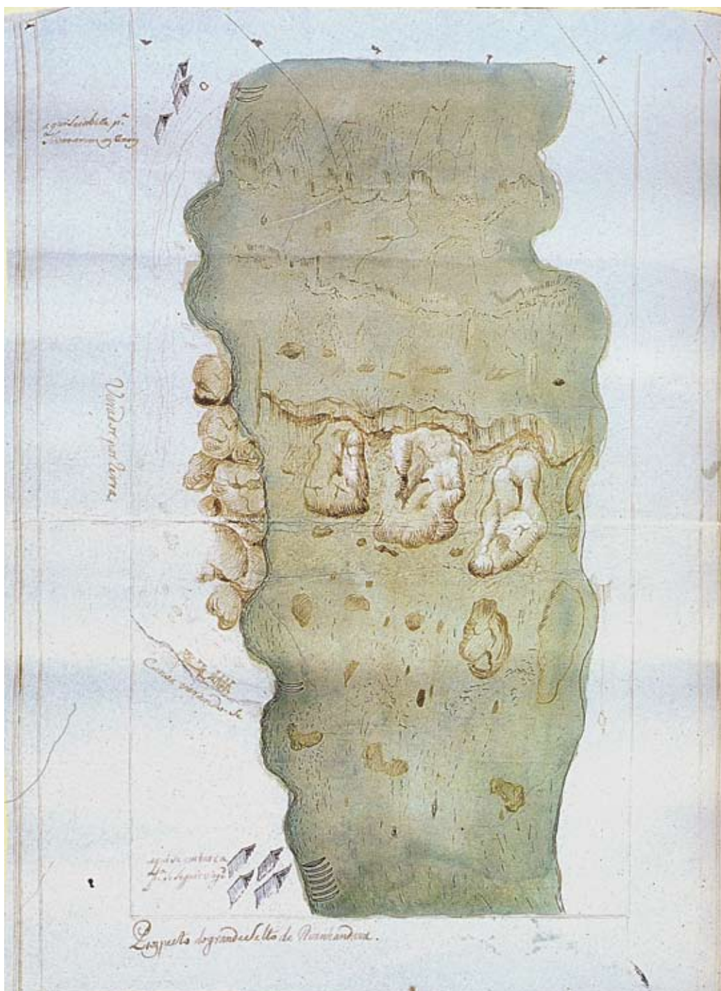
Figura 5 – No lado esquerdo, Juzarte assinalou o lugar onde as canoas embicaram em terra para passar pelo varadouro, com muito perigo e trabalho, e, abaixo, o lugar onde as canoas foram recolocadas no rio para seguir viagem. Teotônio José Juzarte. Prospecto do grande salto de Avanhandava , 1769.