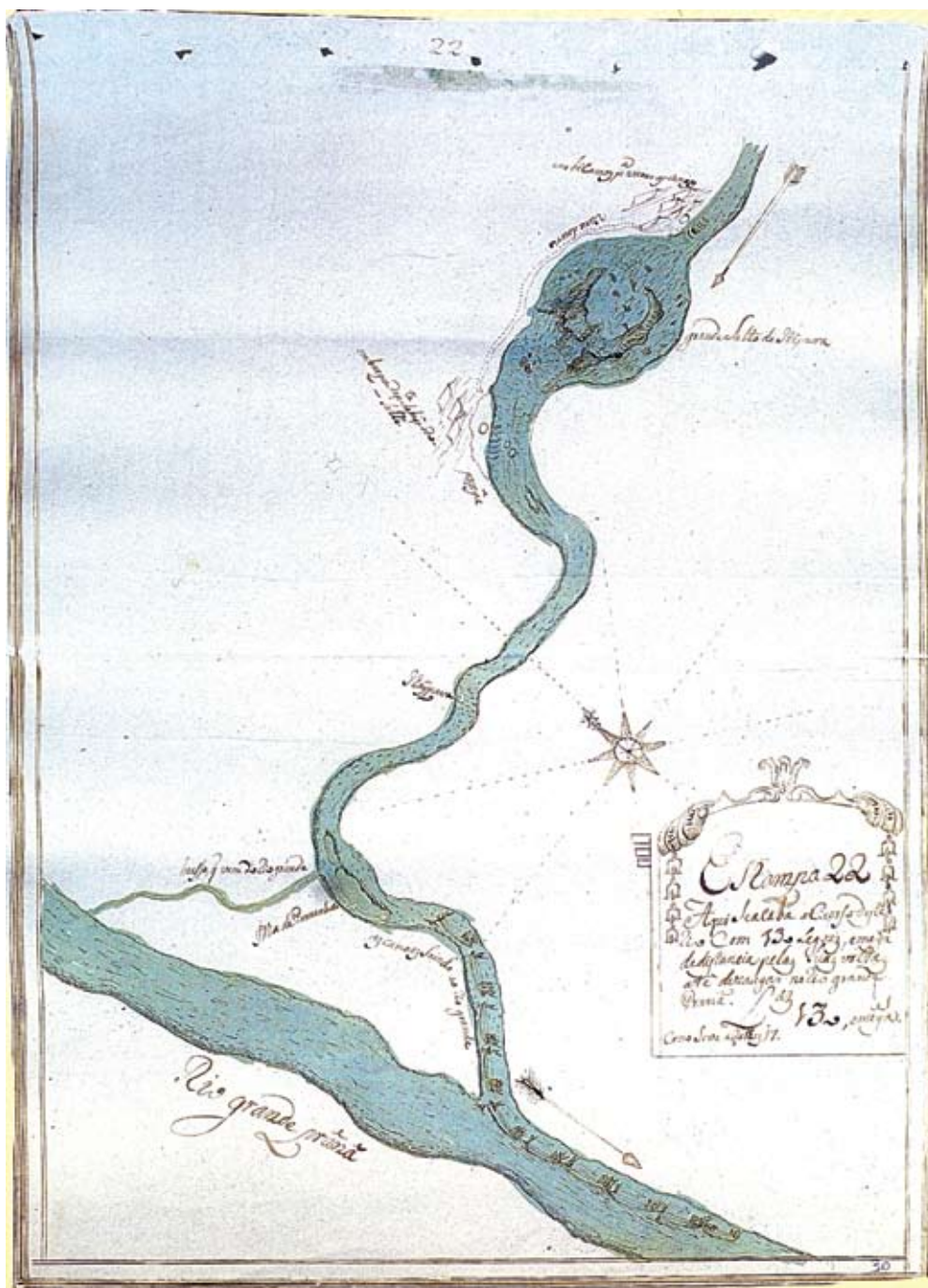
Figura 3 – Teotônio José Juzarte. Na parte de cima do prospecto, Juzarte desenhou o Salto de Itapura, que quer dizer “onde faz ponta a pedra grande”, local em que as canoas vararam por terra; abaixo a seqüência de canoas sinaliza o percurso do rio Grande do Paraná. Aqui se acaba o curso desse rio com 130 léguas e meia de distância pelas suas voltas até desaguar no rio Grande do Paraná. [Dias 5, 6 e 7 de maio.], 1769.