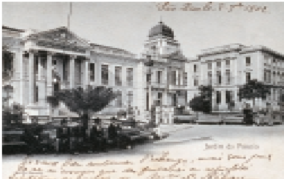
FIGURA 5 – São Paulo, Largo do Palácio, 1902, cartão postal impresso circulado de Guilherme Gaensly.

Agora transformado em Jardim do Palácio, o espaço antes denominado Pátio do Colégio continua sendo valorizado nas tomadas fotográficas. O cartão postal intitulado Jardim do Palácio , de Guilherme Gaensly (circulado em 1902), é exemplar do tipo de enquadramento adotado (FIGURA 5). A imagem de Gaensly apresenta um equilíbrio dinâmico graças às ressonâncias formais entre os grupos de pessoas sentadas ou em pé que pontuam o primeiro plano e o plano médio. Em primeiríssimo plano, no quadrante inferior esquerdo, os bancos do jardim com exclusiva presença masculina. A sombra que cai sobre o grupo sentado impede que este seja o ponto central da fotografia. Por contraste, o olhar é encaminhado para o plano médio, em cujo centro posam três homens fardados de branco, definindo a área mais luminosa da imagem. O triângulo formado pela perspectiva diagonal adotada pelo fotógrafo finaliza no quadrante inferior à direita, também com um grupo de homens, parte sentado, parte em pé. Os edifícios do palácio e da Secretaria da Agricultura conformam o último plano, criando uma barreira que visualmente sugere uma continuidade plástica entre as fachadas de ambos. O centro geométrico, onde se encontram os homens fardados, é reforçado pelo torreão do palácio, elemento que atua, assim, como polarizador formal da imagem.