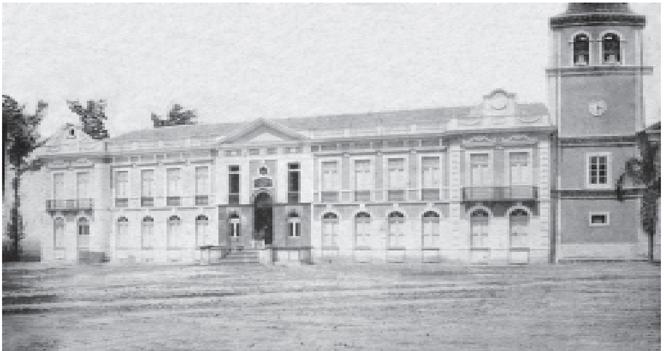
FIGURA 3 – Pátio do Colégio, c.1881, albumina de Militão Augusto de Azevedo.