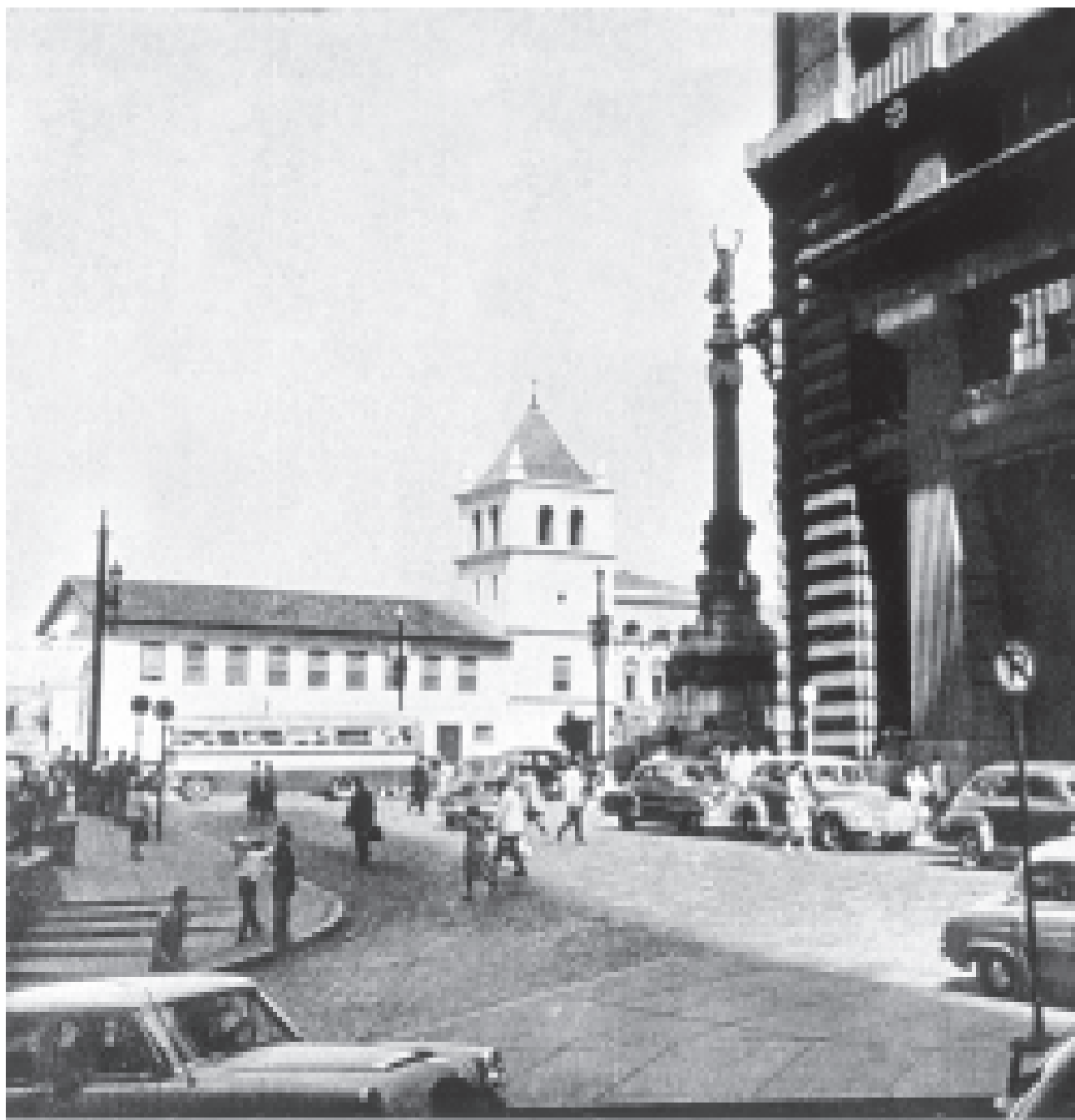
FIGURA 10 – Isto é São Paulo . São Paulo: Melhoramentos, 1956, p. 102.