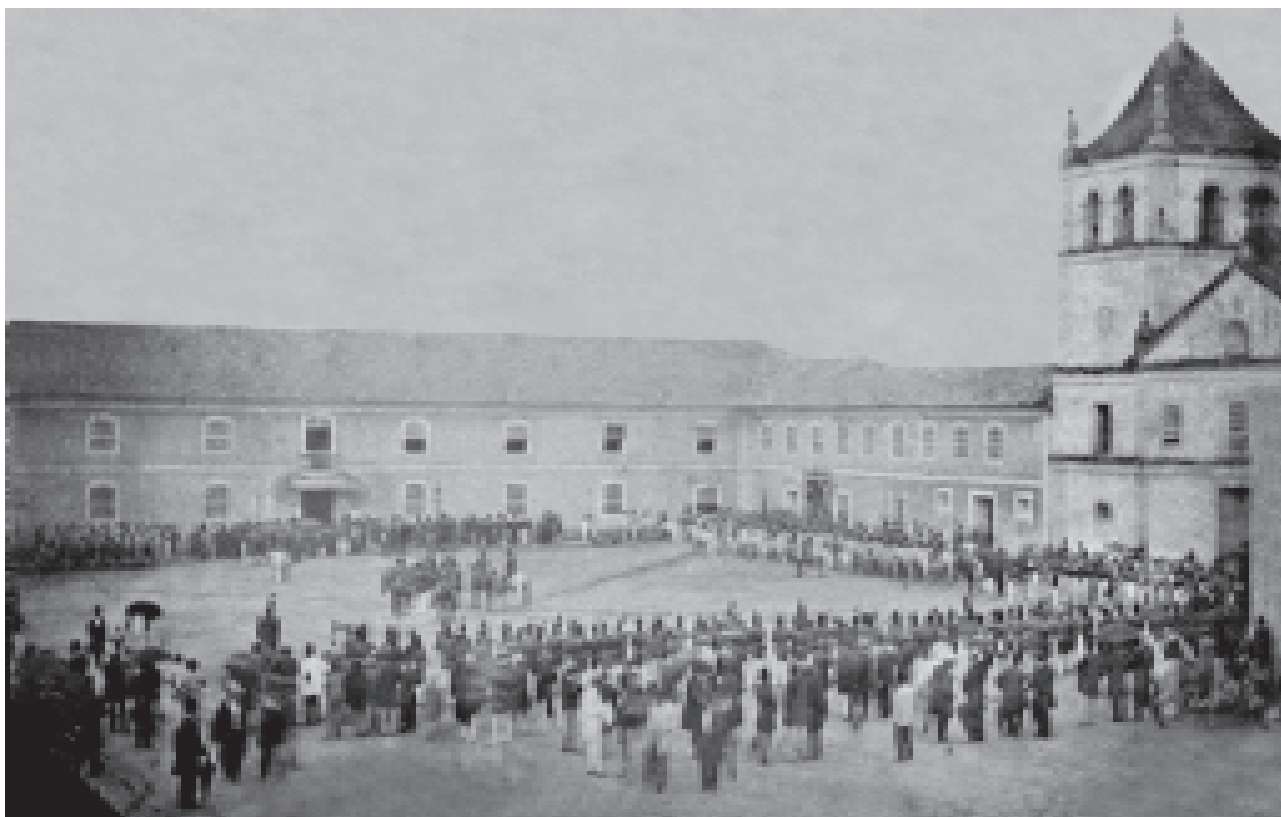
FIGURA 2 – Pátio do Colégio, 1862, albumina de Militão A. de Azevedo. Álbum Comparativo da Cidade de São Paulo – 1862/887 . Acervo Museu Paulista da USP. Reprodução de José Rosael.

Reciclado no seu uso ao ser destinado às atividades do poder público desde 1776, pouco depois da expulsão dos jesuítas, o edifício sofreu as primeiras reformas para ser a sede do governo de Morgado Mateus. Essas alterações, no entanto, pouco modificaram a fachada e o entorno, que continuaram conformando esse espaço tão peculiar do período colonial, sem vegetação e cujos limites eram dados pelas construções. Em seu Álbum Comparativo , Militão optou por registrar o local em 1862, precisamente durante uma celebração cívica. Nesta imagem, diferentemente daquela desenhada por Ender, o ponto de vista escolhido graças ao posicionamento do fotógrafo, provavelmente do alto de uma sacada ou janela, nos oferece uma visão bem mais completa do espaço aberto formado pela construção em L, com destaque para o palácio e a festividade que se desenrola em seu pátio. Mais uma vez, é o espaço aberto que ganha relevância, graças à presença do corpo policial da província e à assistência.