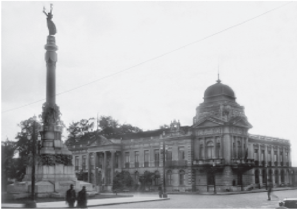
FIGURA 7 – Largo do Palácio, c. 1926, original s/autoria.