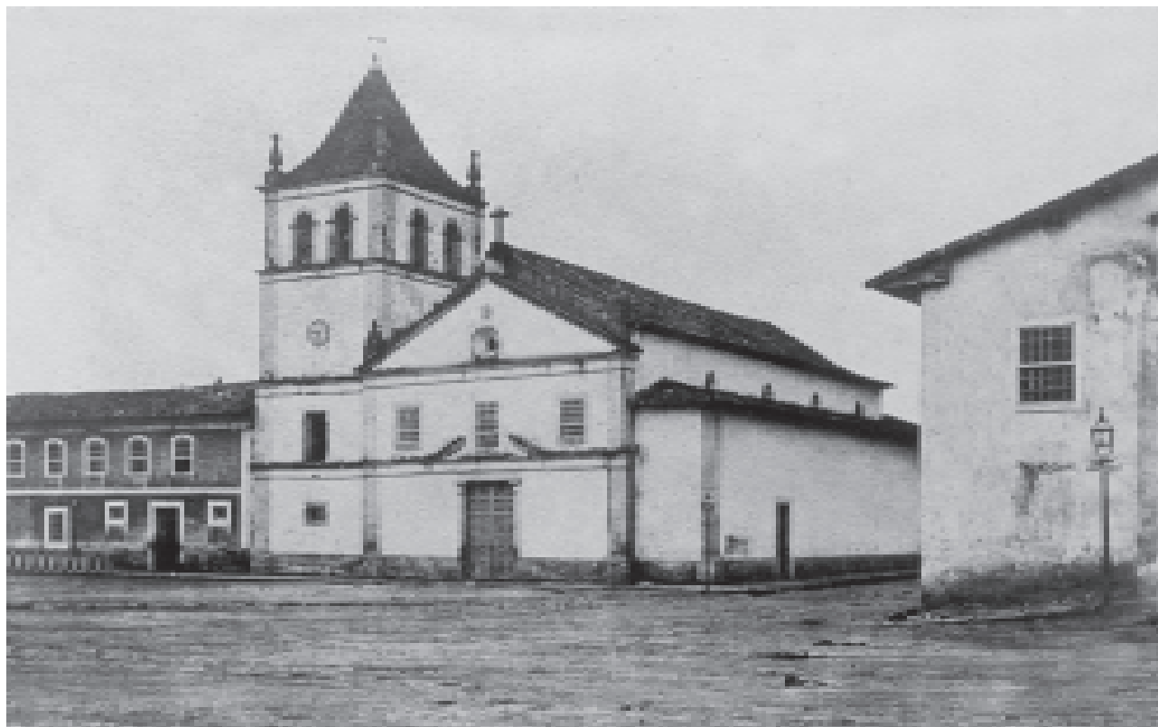
FIGURA 9 – Igreja do Pátio do Colégio, original s/autoria, c. 1860.

15. Uma fotografia desta série foi reproduzida em tela por Jonas de Barros (Ruínas da Igreja do Colégio, 1896, óleo sobre tela, 600 x 355mm), segundo encomenda de Affonso de E. Taunay, e integrada o acervo do Museu Paulista da USP.