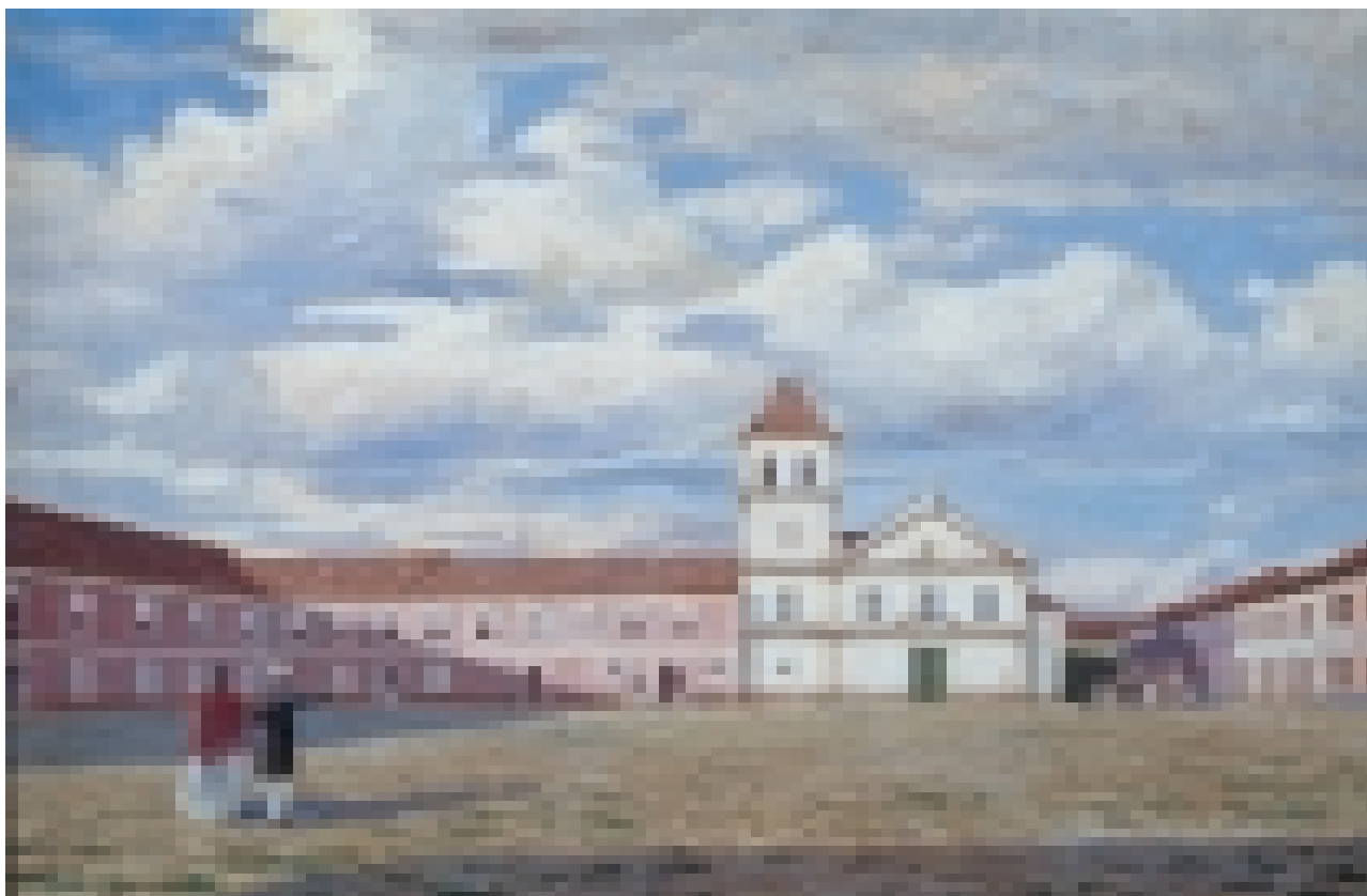
FIGURA 1 – Óleo Sobre tela de Wash Rodrigues, a partir de desenho de Thomas Ender, 66 x 100 cm, 1818. Acervo Museu Paulista da USP.

O desenho de Thomas Ender feito em 1818 (FIGURA 1) e a descrição de Saint Hilaire datada de 1819 4 nos fornecem uma imagem urbana que