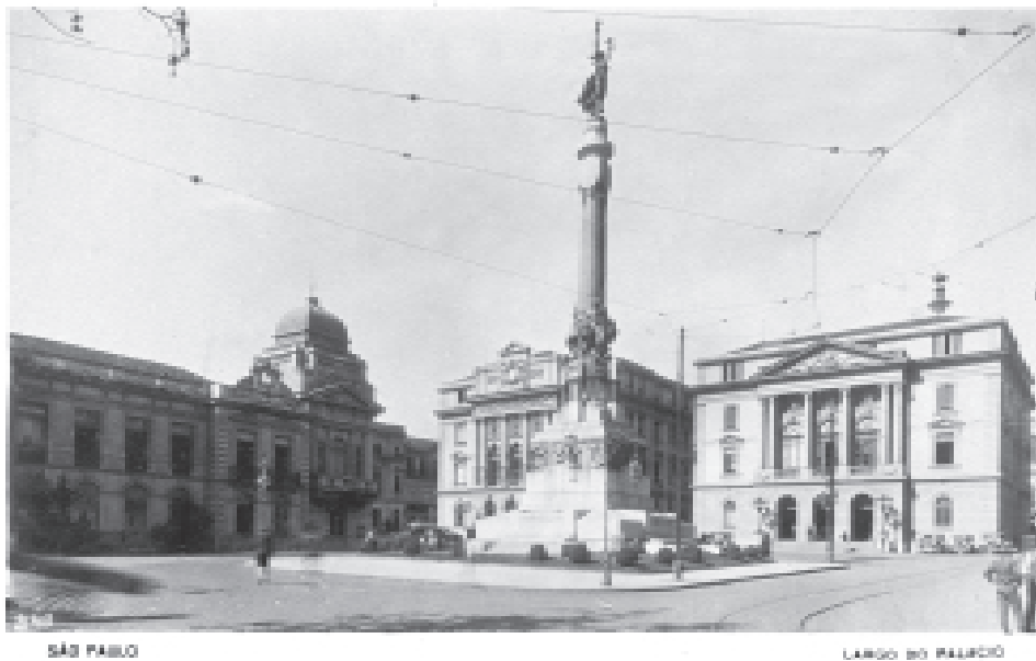
FIGURA 8 – Palácio do Governo, c. 1925, cartão postal fotográfico.