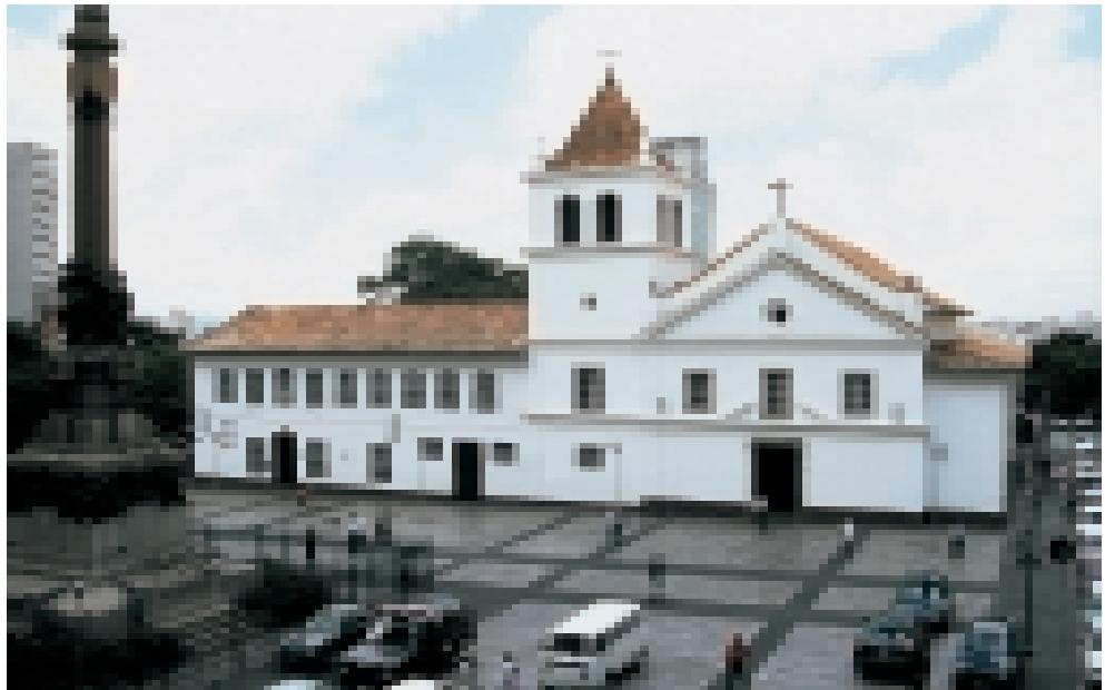
FIGURA 11 – Pátio do Colégio, 1997.

Para além da réplica, contudo, restou como documento, embora pouco valorizado, a posição geográfica deste sítio urbano, capaz de informar sobre o papel de dominação e proteção desempenhado pela edificação jesuítica sobre seu território. Tal como a descreveu Saint Hilaire, em 1819.