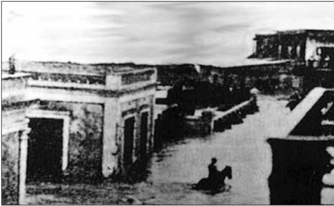
Una calle de Arecibo luego del paso del huracán San Ciriaco, 1899.