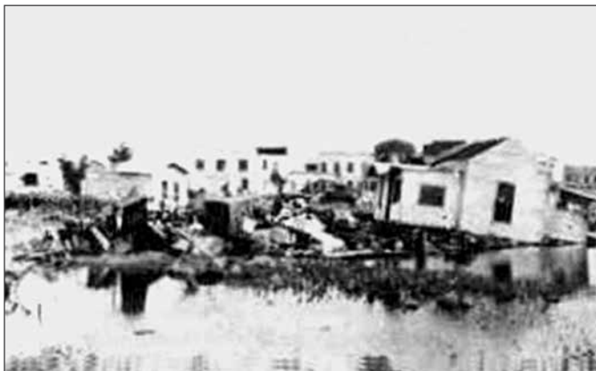
Área de Belle Glade, 1928. A la izquierda se observa el edificio Borce y el Pioneer a la derecha.