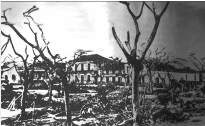
Vista parcial de los daños ocasionados por el huracán San Ciriaco en el pueblo de Caguas, 1899.