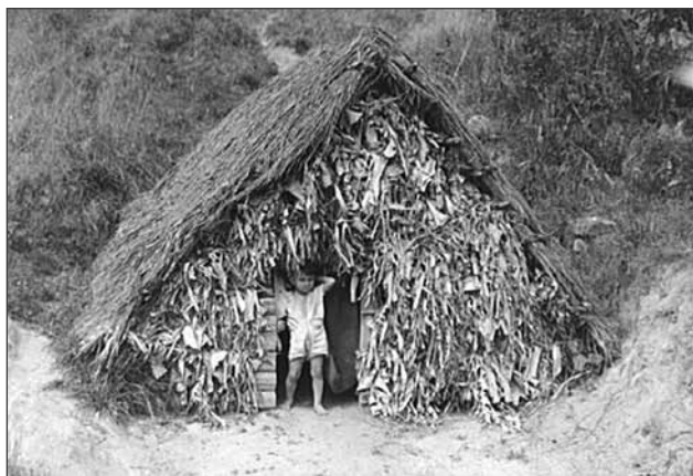
Jack Delano, "Utuado, Puerto Rico (vicinity). Hurricane shelter near the house of a farm laborer", United States. Office of War Information, Overseas Picture Division Biblioteca del Congreso, January 1942.

Pero no era posible darle a los pobres y desposeídos algo a cambio de nada. La reconstrucción debería ser hecha por los campesinos mismos, bajo la supervisión de agencias de ayuda y de comités municipales. Recibirían, además, un pago por su labor, diez por ciento en dinero en efectivo y noventa por ciento en raciones de comida.