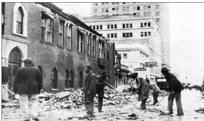
Destrucción ocasionada por el huracán San Felipe a su paso por Olive Street, West Palm, 1928.