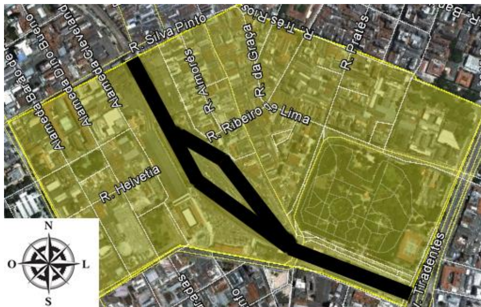
Figura 2: Área de abrangência do projeto Polo Luz, com a linha férrea ao centro.

Como o PRAF, foi o primeiro projeto do governo Covas para intervenção na região, este foi fundamental na definição do perímetro; e, por tratar-se de um programa federal, cujo financiamento estava atrelado às intervenções próximas às áreas das antigas linhas férreas, convencionou-se que o eixo central do programa Polo Luz seria a linha do trem ( figura 2 ).