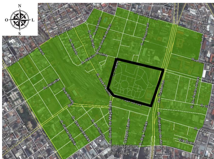
Figura 1: Área de abrangência do programa Luz Cultural, com o Parque da Luz em destaque.

seria divulgada em forma de guia no ano de 1986, tendo como título “Guia Luz Cultural – Museus, Teatros, Bibliotecas, Cursos, Lazer e Serviços”.