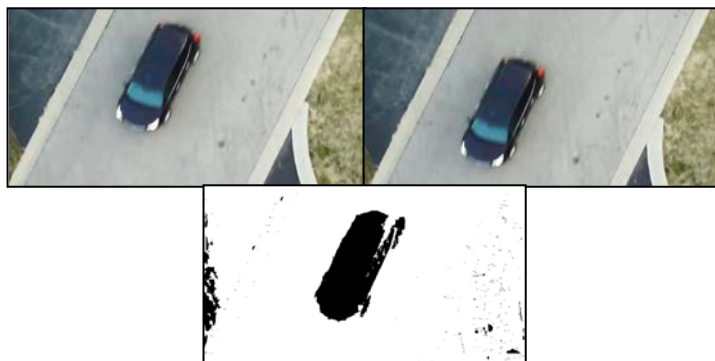
Рис. 1. Маска движения

Таким образом, находится ориентация найденного ПНО относительно кадра, и для всех эталонов задаются две начальные ориентации: совпадающая (при движении объекта вперед) и противоположная ей, т.е. повернутая на 180^0 относительно совпадающей (при движении назад). Затем происходит сопоставление найденного ПНО с эталонами, при этом, помимо совпадающей и противоположной ориентации, рассматриваются эталоны, повернутые на определенный угол \psi , равный 1^0 , т.е. отклоненные от начальных направлений (по четыре раза по направлению движения часовой стрелки и против него). Данная операция последовательного поворота эталонов учитывает погрешность вычисления направления смещения самого ПНО. В результате выполняется по 18 итераций сопоставления для каждого эталона.