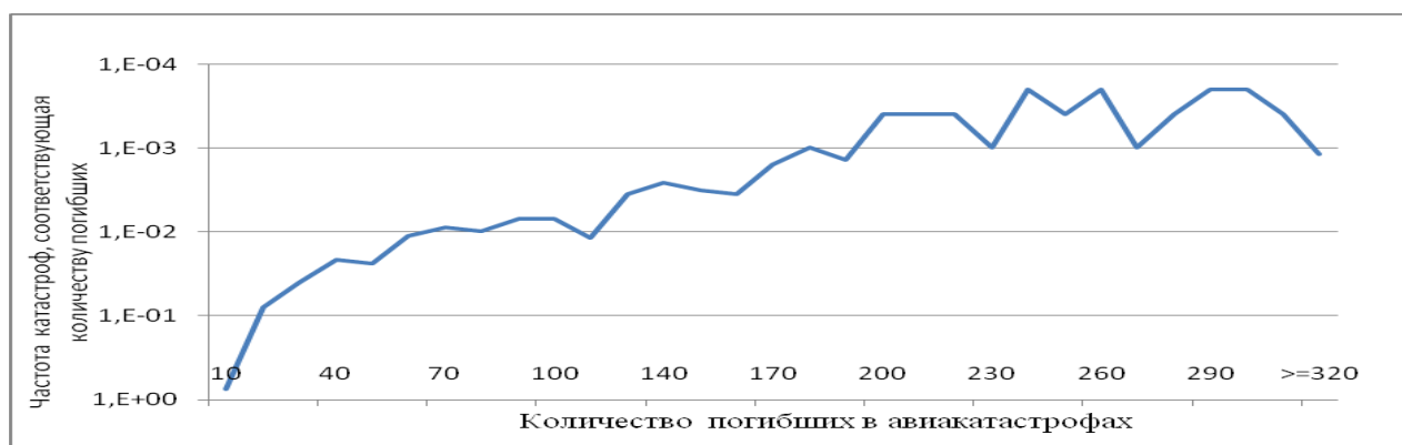
Рис. 5. Зависимость частоты катастроф от количества погибших

где N_i – количество катастроф с определенным числом погибших ( N_1 – количество катастроф с числом погибших от 1 до 20, N_2 – с числом погибших от 21 до 40 и т. д.).