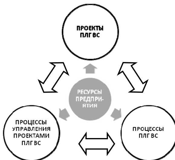
Рис. 1. Система процессов и проектов ПЛГ ВС Fig. 1. The system of AAM processes and projects

сурсы предприятия, поэтому важно идентифицировать и систематизировать все процессы и проекты, оказывающие существенное влияние на результаты его деятельности.