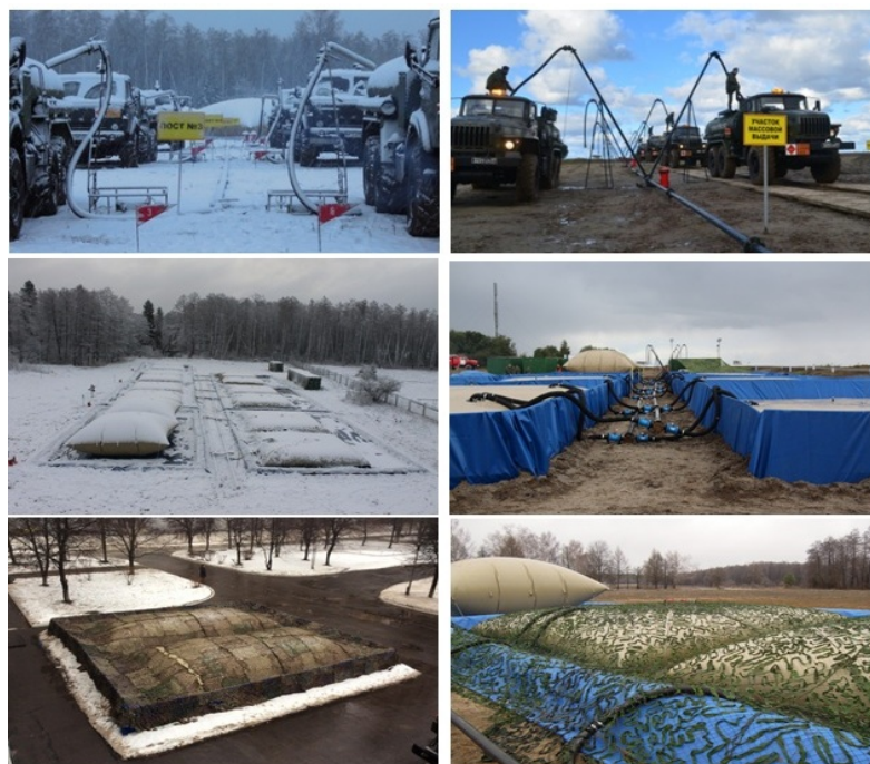
Рис. 2. Модуль полевого склада горючего ПСГ-1000. Основные моменты испытаний

Разработанный ФАУ «25 ГосНИИ химмотологии Минобороны России» [8-11] в сотрудничестве с ООО НПФ «Политехника» модуль полевого склада горючего прошел апробацию в ходе стратегических учений «Кавказ-2012», «Запад-2013» и получил положительную оценку при взаимодействии с трубопроводным и автомобильным батальонами брмото.