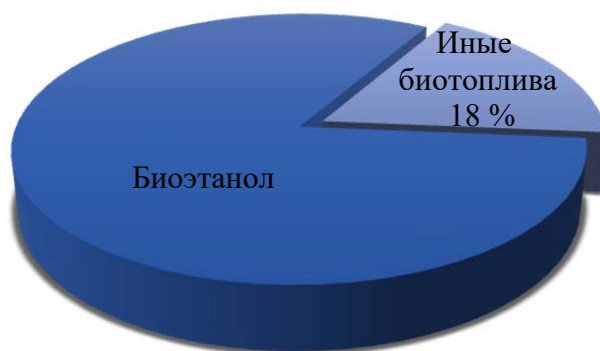
Рис. 1. Доля биоэтанола в мировом объеме производства биотоплива Fig. 1. Share of bioethanol in global biofuel production

На современном этапе развития биотоплив все большее внимание уделяется биотопливам, которые по большей части состоят из биоэтанола (рис. 1) [8]. Применение таких топлив обусловлено прежде всего их высокой экологичностью.