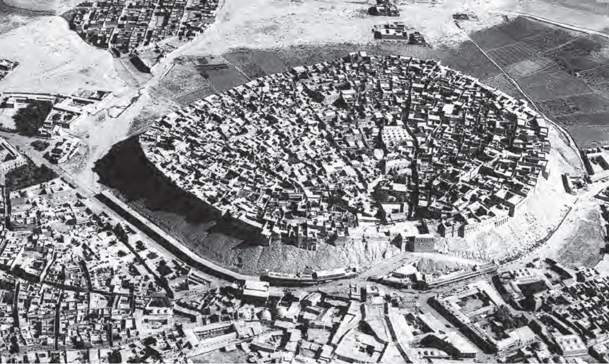
Fotografía: A.E.J. MORRIS. History of Urban Form . Prentice Hall, Londres. 1994. Pág. 9.

El antiquísimo axioma “Como es arriba, es abajo; como es abajo, es arriba”, ofrece una clave para resolver muchos de los problemas y paradojas de los secretos de la naturaleza, pues se propone la ciudad como una entidad que se comporta como un organismo vivo, por contar ésta con todas las características que así definen al organismo.