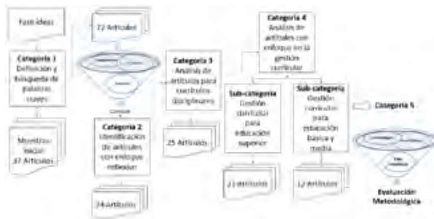
Figura 1. Proceso de selección, clasificación y revisión