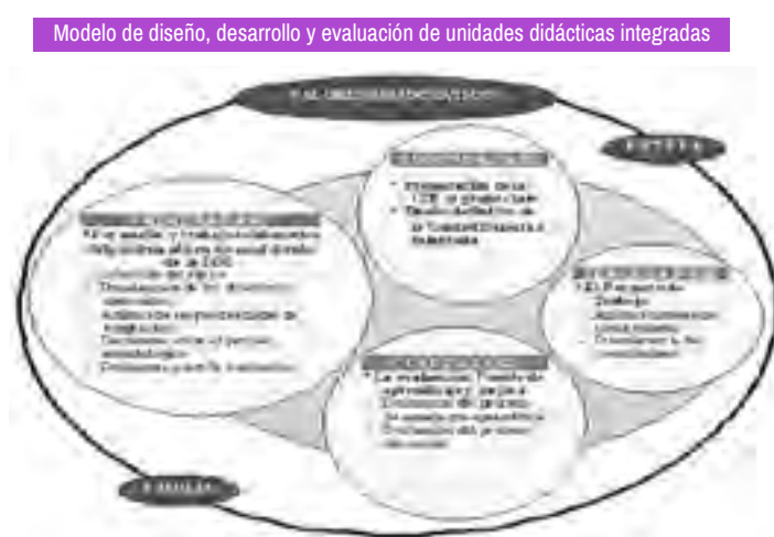
Figura 4. Modelo de diseño, desarrollo y evaluación de unidades didácticas integradas