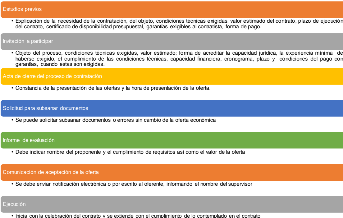
Fig.1 Documentos para un proceso de contratación por mínima cuantía

En Colombia, la contratación por mínima cuantía en el sector G, objeto de este estudio, representó el 27.5% de los 44.208 procesos en las diferentes modalidades de contratación en el país y el 35.62% (677procesos) del total de procesos terminados después de convocados (1901 procesos) en las diferentes modalidades de contratación (Fig. 2).