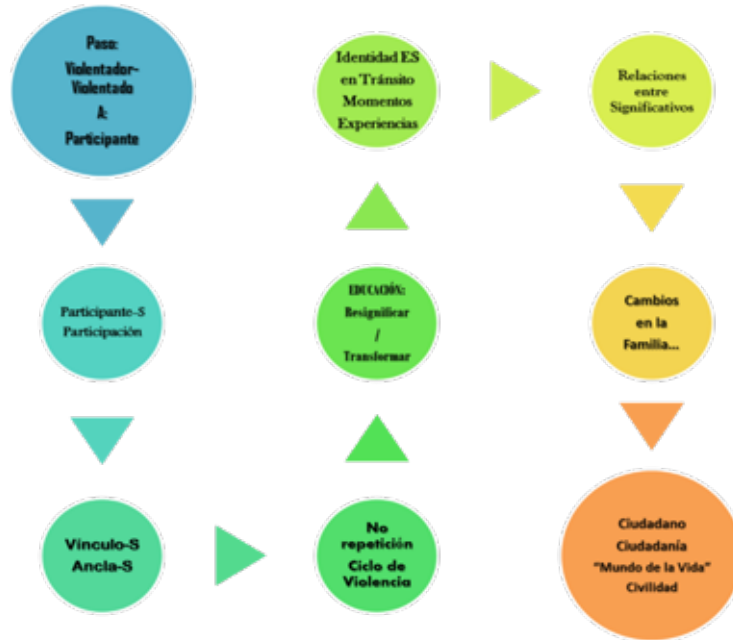
Gráfica 2. Identidades en tránsito, recorrido que se consolida como una posibilidad hacia una nueva condición y estatus