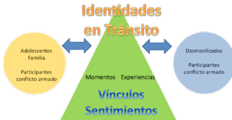
Gráfica 1. Representación de las principales líneas de convergencia: identidades en tránsito/vínculos/sentimientos.