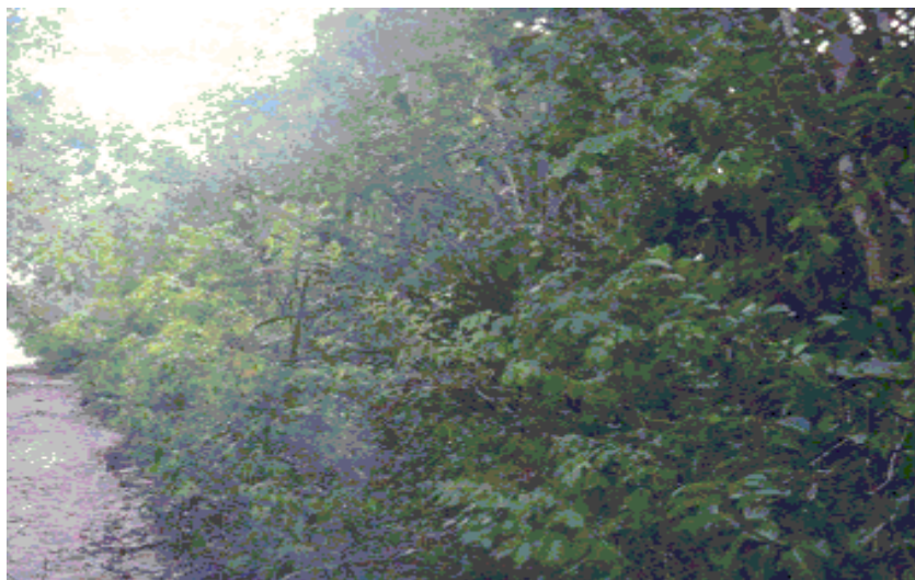
Figura 04 – Vegetação pré-litorânea densa.