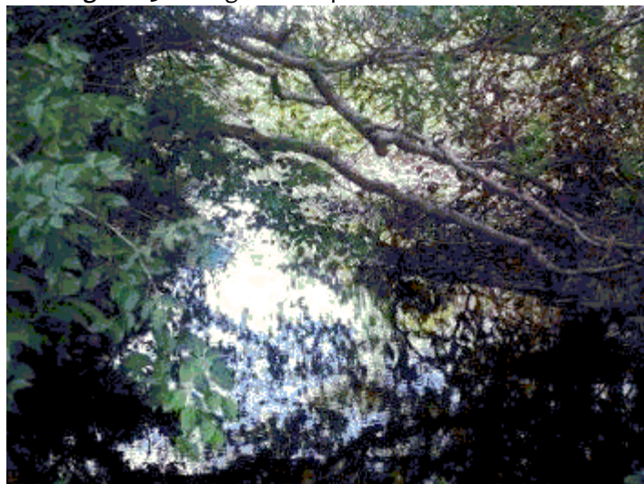
Figura 03 – Margens bem preservadas do riacho em causa.

6) APP do riacho afluente do rio Aracatiaçu