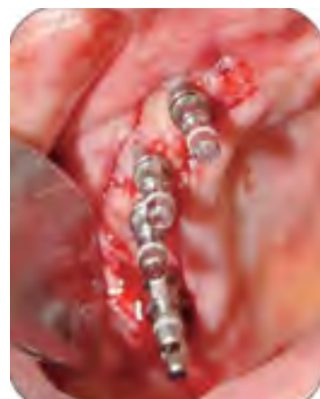
Figura 4. Implantes dentales instalados en sitio injertado con hueso autógeno y fijación con tornillos absorbibles. La incisión es realizada exclusivamente para la instalación de implantes ya que no es necesario el retiro de ningún tipo de material de la primera cirugía reconstructiva

Cuando los materiales son expuestos a cargas, estos deben soportarlas hasta que el proceso de reparación ósea haya finalizado (29) . Ventajas del material absorbible son la biodegradación del material que permite transferencia gradual de estrés para la estructura ósea en reparación permitiendo la remodelación ósea (30) con semejante estabilidad a la entregada por la fijación de titanio. Sin embargo, la gran ventaja de estos materiales cuando se emplean en reconstrucciones óseas está en el hecho de no necesitar retiro posterior a las fases de reparación ósea (31) ; finalmente, el uso de material absorbible permite un procedimiento de instalación de implantes realizado con anestesia local, de forma más rápida y con poca morbilidad (figura 4). Las desventajas de este material están en los costos más elevados, la dificultad técnica con la necesidad de pasar un fabricante de rosca (macho de rosca) después de la fresa del sistema utilizado, mayor tamaño de los tornillos utilizados y, finalmente, la radiolucidez del material que impide realizar una correcta visualización posoperatoria con estudios de imagen (27) .