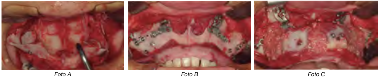
Figura 2. Reconstrucción maxilar utilizando material metálico. A. Bloques óseos en seno maxilar con tornillos de fijación metálico. B. FIR de maxila después de realizar la osteotomía Le Fort I. C. Bloques óseos fijados con tornillos de titanio con técnica compresiva