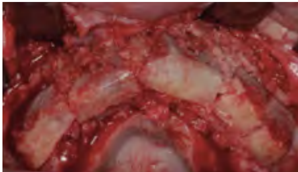
Figura 3. Reconstrucción maxilar utilizando material absorbible, identificando la instalación de los bloques óseos con los tornillos absorbibles

Los materiales absorbibles son elaborados con polidioxanona (PDS), ácido poliláctico (PLA) y ácido poliglicólico (PGA), siendo todos ellos de alto peso molecular. Pueden ser utilizados de forma aislada o asociando diferentes proporciones para alterar las cadenas estructurales del material (26) (figura 3).