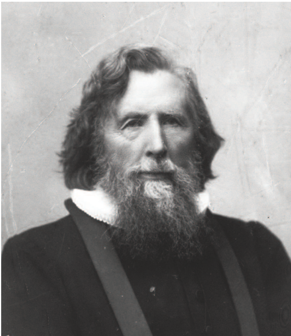
Christopher Bruun I samarie fra omkring 1905.

rammet. Benkene begynte å riste som om det skulle være i en sporvogn, melder Aftenposten dagen etter. Bruun fortsatte ufortrødent videre, men panikken begynte å gripe om seg blant de om lag 1000 tilhørere. En kvinne skrek høyt, det høstes glass som knuste, og i løpet av noen sekunder var alle på beina. I løpet av kort tid var kirken tømt. Men Bruun ga seg ikke, han talte til ende, om enn for tomme