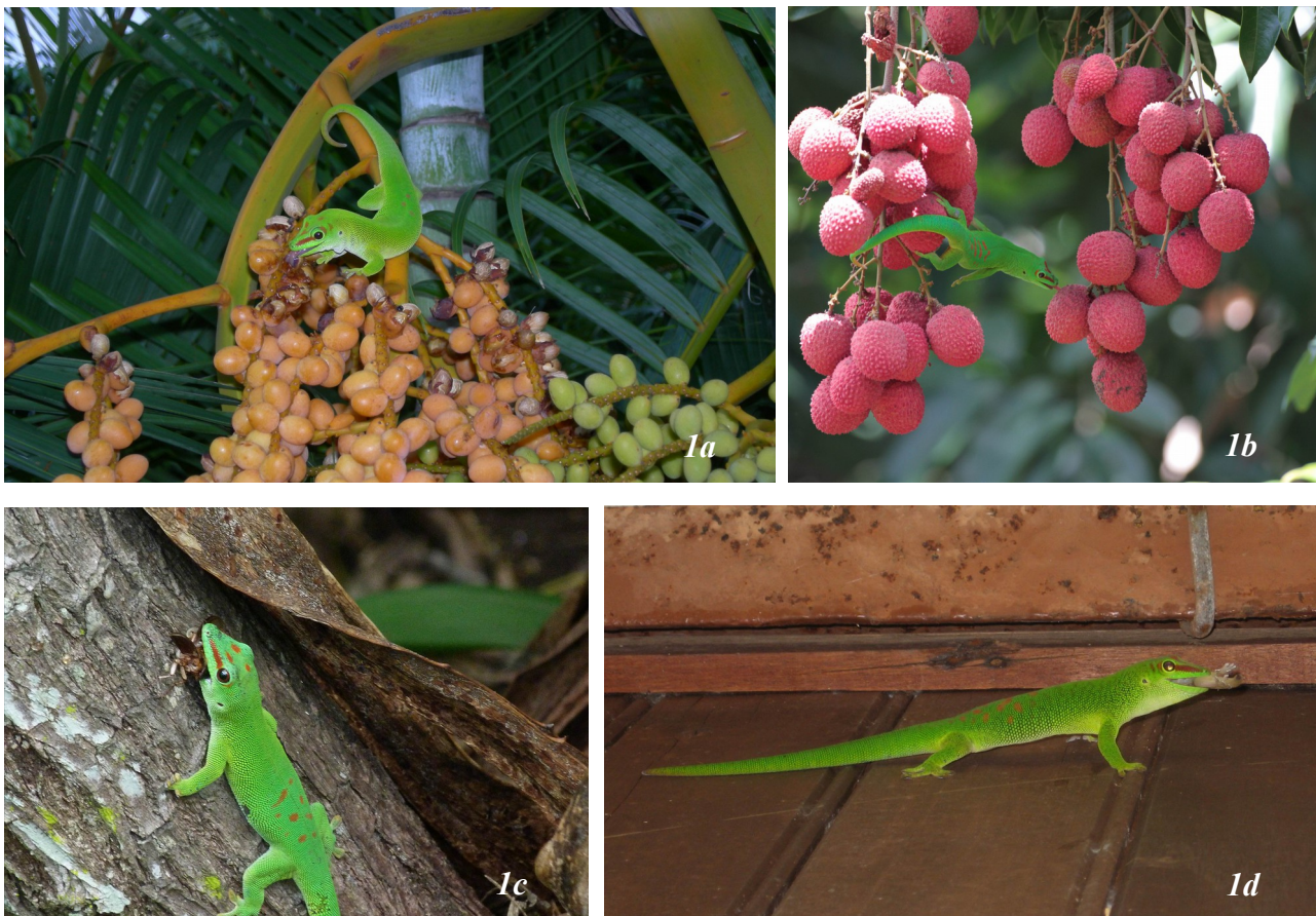
Figure 1. – Phelsuma grandis Gray, 1870 s'alimentant 1a) sur les fruits d'un palmier multipliant ( Dypsis lutescens ) ; 1b) sur les fruits de litchi ( Litchi sinensis ) ; 1c) d'un coléoptère ; et 1d) d'un gecko nocturne ( Gehyra mutilata ).

Le régime alimentaire de P. grandis est encore mal connu. En milieu naturel, la littérature signale la consommation de nectar de fleurs, de pulpe de fruits, de bourgeons floraux (PROBST, 1999 ; KRYSKO & HOOPER, 2006, 2007 ; COLE, 2009 ; SANCHEZ non publié), d'Arthropodes (PROBST, 1999 ; COLE, 2009) et de petits vertébrés, dont des juvéniles conspécifiques (BUCKLAND, 2009 ; COLE, 2009). En captivité, l'espèce consomme également du nectar de fleurs et de la pulpe de fruits (SWITAK, 1966 ; TYTLE, 1992 ; HENKEL & SCHMIDT, 1995 ; FURRER et al. , 2006 ; KOBER, 2008), des Arthropodes : Blattidae, Acrididae et Tenebrionidae (SWITAK, 1966 ; DEMETER, 1976 ; TYTLE, 1992 ; HENKEL & SCHMIDT, 1995 ; FURRER et al. , 2006 ; KOBER, 2008 ; KLARSFELD, 2010) et de petits vertébrés : geckos, anoles et jeunes souris (KLARSFELD, 2010 ; SANCHEZ non publié) (Fig. 1).