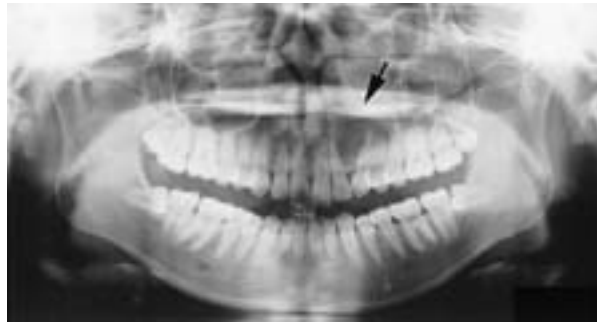
図1 回転パノラマエックス線所見：上顎左側側切歯と犬歯歯根を離開する，嚢胞様X線透過像を認める。(矢印)

処置および経過：上記診断により手術的治療の必要性があるため患者の同意を得て，平成15年10月8日に大分大学医学部附属病院歯科口腔外科へ加療依頼を行った。平成15年10月24日に外来局所麻酔下で左上顎嚢胞開窓術を施行した。切開はPartchのI法に準じて，左上顎側切歯から左第一小白歯の範囲で唇・頬側歯肉歯槽粘膜移行部付近にかけて弧状に粘膜骨膜切除を行った。同部の皮質骨は菲薄化しており，ここを中心に同心円状に骨を削除したところ，嚢胞壁を確認しこの部の嚢胞壁を切除した。