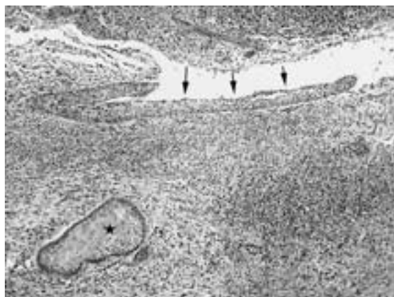
図5 病理組織学的所見 (HE, ×400):嚢胞内腔を裏装し角化傾向を呈する扁平上皮(矢印)と、上皮下結合組織内に観察される小上皮島(★)