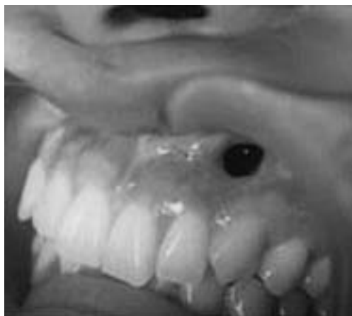
図3 手術3か月後の口腔内写真