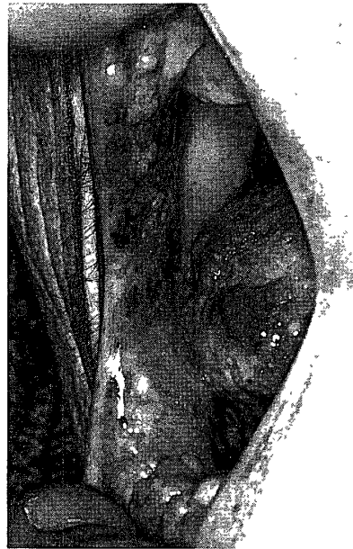
写真4 右口角, 頬粘膜病変