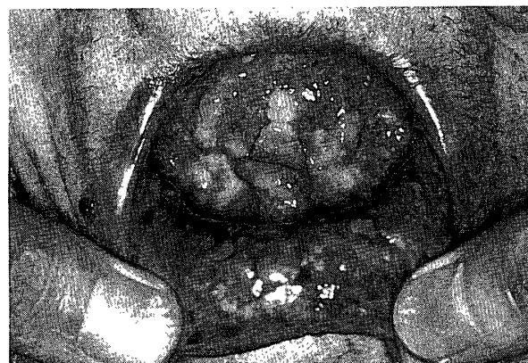
写真2 舌下面，下口唇粘膜病変