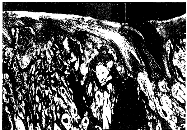
写真6 病理組織像, 同切片のコンゴレッド染色を 偏光顕微鏡で観察 塊状の物質は黄緑色偏光 (写真では白色) を 示す。

均質に染まる部分が認められ, この部分をコンゴレッド染色すると強陽性に染まる塊状の物質が認められた。(写真5)。偏光で観察するとコンゴレッド強陽性部に一致して黄緑色の偏光を認めた(写真6)。またpH7.0トルイジンブルー染色を同様に偏光で観察するとオレンジレッドに輝いて認められた。この塊状の物質は舌筋間の小動脈壁にも, また舌筋間線維性組織中にも認められた。以上の所見からこの沈着物質をアミロイドと判断し, 本症をアミロイドーシスと診断した。