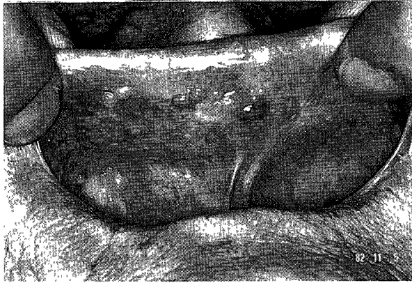
写真7 上唇粘膜病変

は舌側縁の腫瘤は一層増加し、また舌も厚くなり巨舌を呈した。さらに口腔粘膜の腫瘤は頬粘膜、上唇粘膜まで拡大した(写真7)。昭和58年7月の心電図では低電位差が一層著明になったため内科入院となった。しかし入院3か月後に心不全にて死亡した。