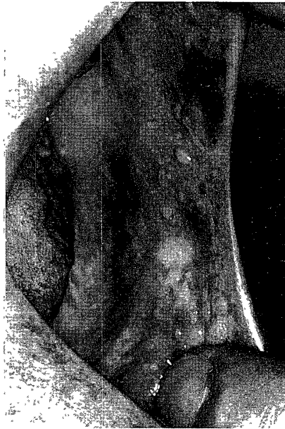
写真3 左口角, 頬粘膜病変