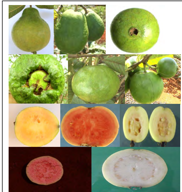
Figura 1. Las dimensiones y forma de los frutos, así como la coloración de estos últimos, constituyen excelentes caracteres diagnóstico en Psidium guajava , pero los caracteres señalados, no resultan apreciables en los materiales de herbario convencionales.