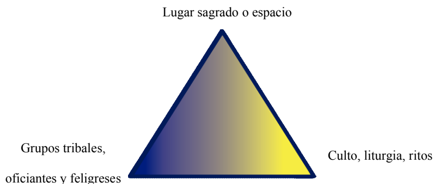
Fig. 1: Triada de componentes antropológicos generales

Como resultado de la revisión bibliográfica se pudo constar que para un análisis antropológico es importante de ciertos fenómenos de esta naturaleza es importante considerar los componentes siguientes: el lugar sagrado o espacio consagrado, grupos tribales y culto, liturgia y ritos. Estos componentes no solo pueden ser utilizados en el análisis de las culturas antiguas sino también en la conducta de ciertos grupos actuales. En esta revisión bibliográfica algunos antropólogos aluden a estos componentes, pero de forma aislada pero no integralmente. Sin embargo, en los partidos disputados se puede observar que estos los elementos están intimidante integrados(Ver Fig. 1).