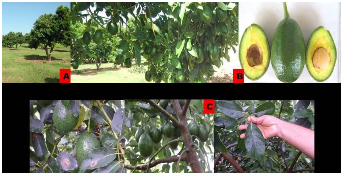
Fig. 2. A y B) Árboles en producción y frutos en la UCTB Alquizar. C) Frutos, ramas y hojas en plantación de Pinar del Río.