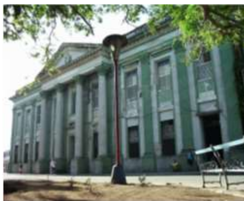
Fig. 2 Luaces no. 1

Está constituido por dos claustros rodeados por galerías de arcos de medio punto, que responden a los códigos clasicistas aunque estos son más evidentes en la fachada principal. En el interior, aún son visibles techos de armadura y la conformación de patios claustrales, rasgos que pudieran haber sido heredados de la estructura conventual de la etapa colonial. Se desarrolla en dos niveles (el tercero es resultado de intervenciones posteriores). Sus altos puntales, espacios amplios y bien aireados, confirman la distinción que posee el edificio, sin excesivas decoraciones excepto las galerías y algunos espacios de centralidad y circulación con vanos adintelados. De forma general, se mantienen las características esenciales de la edificación, que permiten una lectura clara del inmueble original y de las adiciones posteriores. En algunos espacios las transformaciones son irreversibles y existe una estratificación que responde a diversos períodos.