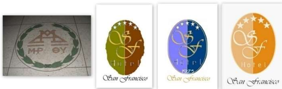
Fig. 7. Detalles de la propuesta de identidad visual

isoc3. Respecto al análisis del color, luego de plantear tres propuestas (Fig. 7); se escogió como definitiva la de los colores 410 durazno y 414 mostaza 2 .