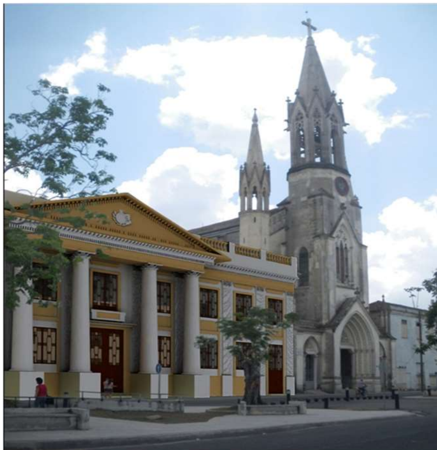
Fig 6. Fachada principal

Para la identidad visual del hotel se tomó como referencia el estilo arquitectónico del inmueble y antecedentes de la zona de estudio. Es por ello que la combinación de dos tonalidades de la gama del color seleccionado, representa la variedad de estilos y componentes del Eclecticismo y la línea vertical define el equilibrio; representativo de la simetría, característica principal del estilo Neoclásico (Fig. 6).