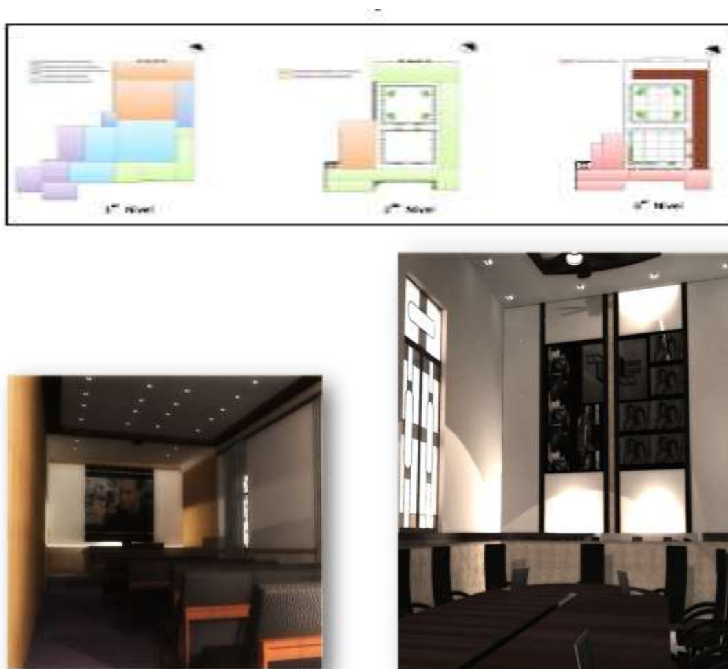
Fig. 5. Función principal: cultural. Salas de Intercambio

huéspedes desde el interior del edificio, y otro lateral, que facilite a través de escaleras el acceso desde el exterior. El complejo propuesto cuenta con un área de venta de artículos, sala de estar, un departamento técnico y oficina administrativa, sala de conferencia, oficina para traductores, local de la prensa, sala de proyección, sala para mesa redonda y un cibercafé para el intercambio de conocimientos y búsqueda en internet.