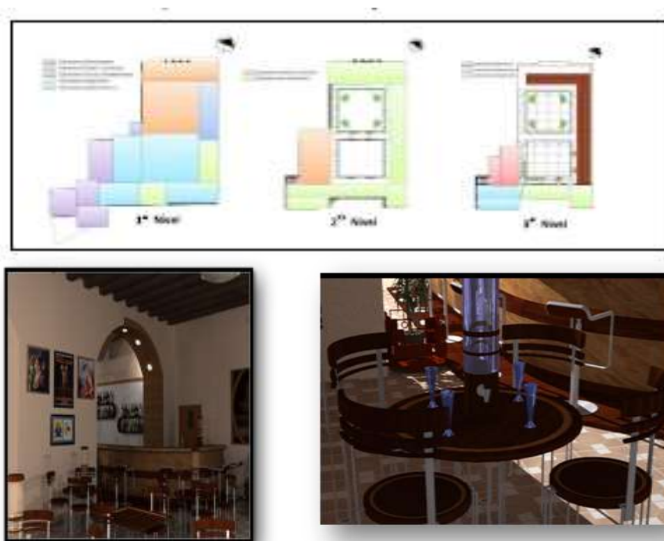
Fig. 3. Función principal: gastronómica. Minicervecería

La principal atracción de esta variante, es la propuesta de minicervecería (Fig. 3) que permitirá al cliente observar el proceso de elaboración de cerveza artesanal. Ubicada en el primer nivel, cuenta con un acceso para los huéspedes del hotel desde el interior del edificio, y otro ubicado por la calle San Fernando que facilita la entrada desde el exterior. Además, tiene un área de mesas, mostrador, área de elaboración de la cerveza artesanal, un almacén y servicios sanitarios para hombres y mujeres.