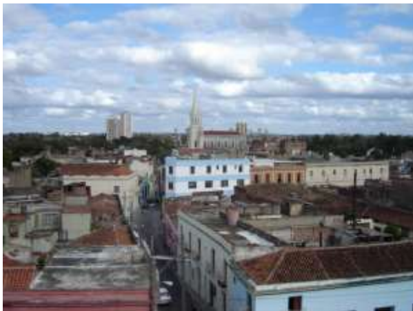
Fig. 2 Hitos de la ciudad tradicional y moderna representados por las iglesias y los edificios altos

La ciudad de Camagüey es el resultado de 493 años de desarrollo que han dejado huellas en su estructura física (Figs. 2, 3 y 4). En los últimos cien años ha crecido el