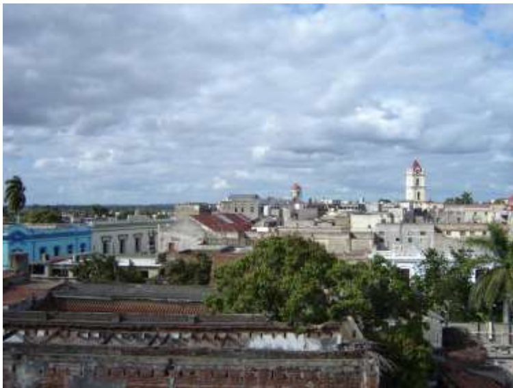
Fig. 7 Sector tradicional en la actualidad

Según el censo existente, posee 3 km 2 con 322 manzanas en las que están ubicadas alrededor de 10 000 edificaciones. Se ha determinado que unas 2 000 poseen valor ambiental, arquitectónico, histórico o tienen un carácter excepcional o típico. El trazado irregular de la ciudad difiere de la mayoría de las fundaciones del Nuevo Continente. Su caracterización tipológica-urbana es el resultado de una estructura formada por calles estrechas y sinuosas y un conjunto de plazas y plazuelas,