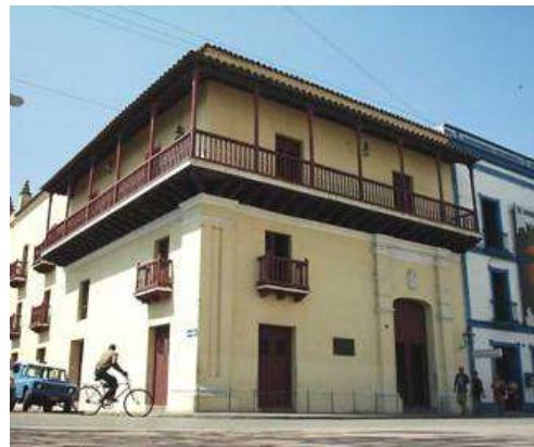
Fig. 3 Hitos del repertorio doméstico de la ciudad tradicional. Casa natal de Ignacio Agramonte