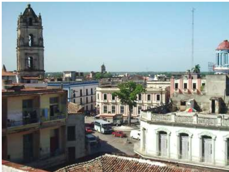
Fig. 8 Espacio público de la ciudad tradicional. Plaza de la Merced, actualmente Plaza de los Trabajadores

Su patrimonio cultural se convierte en una de sus mayores potencialidades y define la vocación turística, pues agrupa los componentes de la cultura material y espiritual. Por otro lado el desarrollo de un turismo responsable incluye el tema de la identidad nacional que lleva implícito la conservación integral de los paisajes culturales urbanos y está muy unido a la imagen del destino; en ello puede atender considerablemente la calidad social relacionada con los