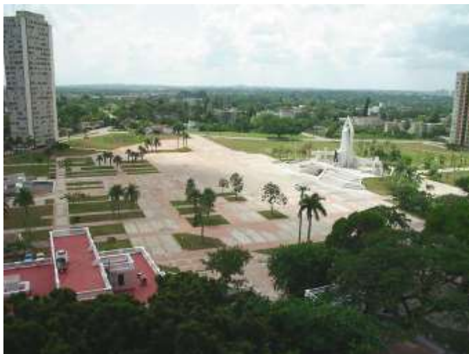
Fig. 4 Espacio público creado para dar respuesta a las nuevas funciones de la ciudad. Plaza de la Revolución "Ignacio Agramonte"