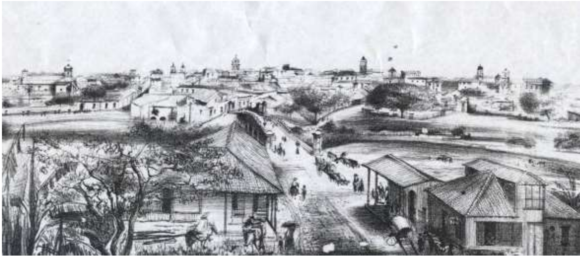
Fig. 6 Grabado que muestra el sector tradicional a finales del siglo XVIII