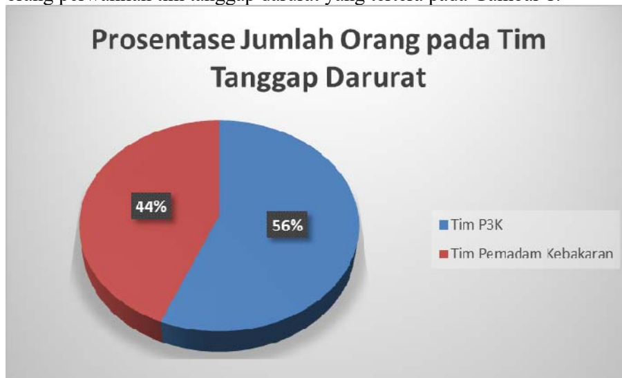
Gambar 1 Presentase Jumlah Tim Tanggap Darurat

Berdasarkan table diatas, maka masing-masing gedung memiliki perwakilan yang dimasukkan menjadi anggota tim tanggap darurat, dimana orang tersebut memiliki kewajiban di gedung masing-masing. Dari hasil wawancara, terdapat 80 orang perwakilan tim tanggap darurat yang tertera pada Gambar 1.