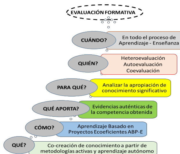
Figura 1. Características de la evaluación auténtica metacognitiva