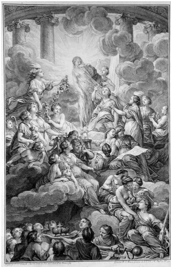
Figura 2. Frontispicio de la Encyclopédie , grabado de Bonaventure Louis Prévost, según el dibujo de de Charles-Nicolas Cochin

La luz, por tanto, posee un rol fundamental para explicar la epistemología de la época (Hulme y Jordanova, 1990, pp. 1-15). Era la metáfora central del conocimiento y se apoyaba en la creencia de que todo conocimiento provenía de los sentidos, siendo la vista el principal y la observación la actividad característica del ser humano. De hecho, el ciego de Molyneux (la paradoja de si un hombre nacido ciego que recuperara la vista sería capaz de reconocer las cosas que había distinguido por el tacto) recorrió todas las teorías del conocimiento, desde Locke a Diderot, pasando por Berkeley y Hume. La Ilustración era un proceso de desvelamiento más que un estado, y la observación un acto más colectivo que individual, pues no conviene confundir –como ha señalado Lorraine Daston– la luz interior del misticismo y el entusiasmo con la luz social que a través de las cartas, las memorias, los periódicos o los experimentos se generaba (Klein, 2001, p. 149). Quizás entonces las luces del siglo se asemejaran más a una conversación ilustrativa, un acto de