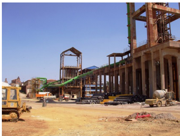
Fotografía tomada en agosto de 2007.

El Plan Nacional de Patrimonio Industrial , aprobado inicialmente en 2001 y revisado en el año 2011, enfatiza también la necesidad de la sostenibilidad. Es, de algún modo, un cambio de paradigma, un nuevo enfoque con gran repercusión en el patrimonio industrial por lo que representa de conservación preventiva de los bienes, la implicación de la sociedad y sus instituciones, la gestión proactiva de los recursos y el uso responsable por los ciudadanos. Estas son las garantías de que el legado material e inmaterial de la revolución industrial permanezca como bien social, factor de cohesión y testigo de la historia de los territorios. El patrimonio industrial, así como sus extraordinarios paisajes asociados, constituye un enorme yacimiento de recursos culturales de gran potencia y visibilidad y actúa como elemento estructurante de las más variadas acciones de intervención, investigación, creación y difusión de proyectos de dinamización económica y social fundamentados en el turismo.