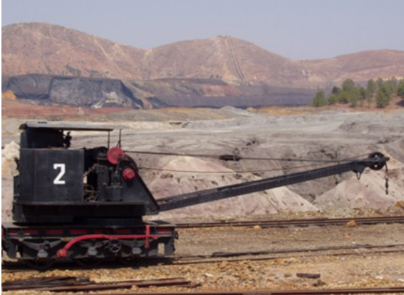
Figura 3. Zona minera de Riotinto (Huelva)