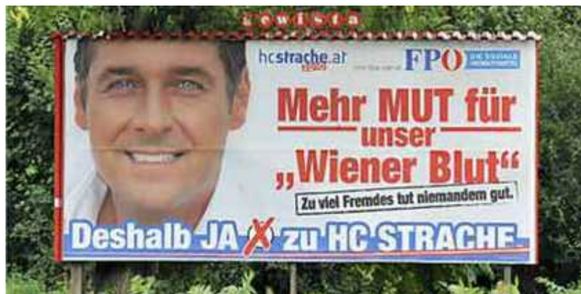
Gambar. 3 Baliho kampanye partai konservatif kanan Freedom Party (FPO) pimpinan Heinz Christian Strache. Dengan mengusung slogan “Terlalu banyak orang asing bukanlah hal baik”.