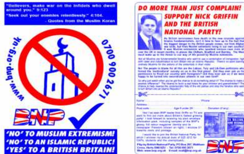
Gambar. 2 Selebaran yang digunakan saat kampanye oleh partai BNP di Inggris.

New Democratic Party, dan di Inggris pada British National Party (lihat gambar 2) (New York: W.W Norton Company, 2011: 30-31).