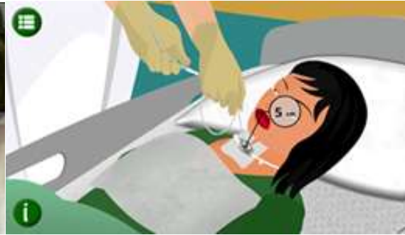
İşlem basamağına uygun olarak hazırlanmış oyundaki ekran görüntüsü

Şekil 1. Senaryoda yer alan bir işlem basamağına ait hedef ve öğrenci beklentilerinden bir örnek.