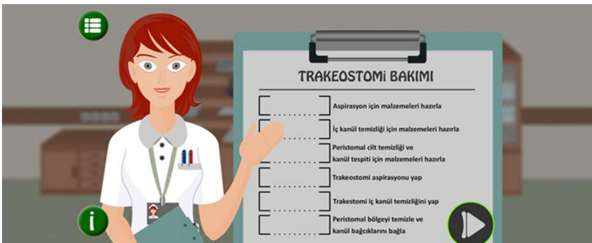
Resim 2. Oyunun aşamalarına ilişkin ekran görüntüsü