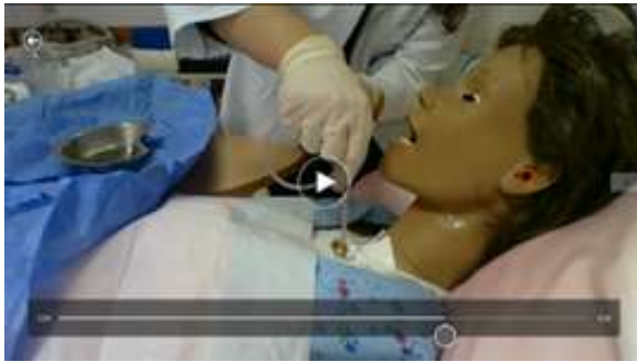
Senaryoda yer alan işlem basamağının video görüntüsü

Beklentiler: Kateterin yaklaşık 10 cm olacak şekilde, hasta öksürüne ve dirençle karşılaşana kadar ilerletilmesi. Öğrenci avatarın tuttuğu kateteri eli ile kanüle doğru sürükler ve kateteri kanülden içeriye ittirir. Ne kadar ilerletmesi gerektiğini belirlemek için ekranda bir sayaç çıkar. Öğrenci kateteri ilerlettikçe sayaç da ilerler ve 10 cm ilerlediğinde sistem daha izin vermez. Kateter kanül içindeyken öğrenci avatara parmağı portu açıp kapatma talimatı verir ve kateter kendi etrafında döndürülerek çıkartılır.