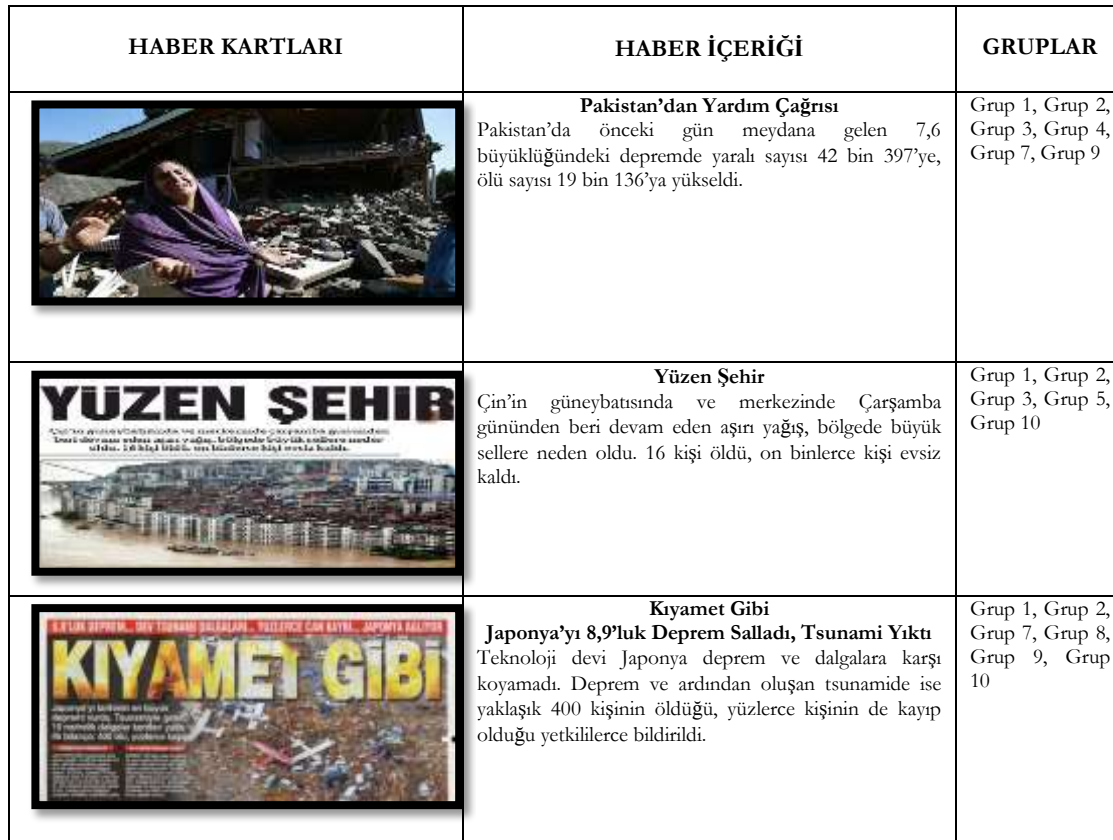
Tablo 1. Uluslararası yardıma gerek duyulan haber kartları ve gruplara göre dağılımı

Etkinlik kapsamında öğrencilerin küresel sorunlara karşı gösterdikleri duyarlılıkları belirlemek amacıyla araştırmacılar tarafından önceden hazırlanan, dünyadan haberlerin yer aldığı haber kartları gruplara dağıtılmıştır. Bu haber kartlarında, Pakistan depremini içeren ‘Pakistan’dan Yardım Çağrısı’ haberi, Çin’de yaşanan sel felaketini konu alan ‘Yüzen Şehir’ haberi, Japonya’daki tsunami ve deprem haberini içeren ‘Kıyamet Gibi’ manşetli haber, Kanada’da da yaşanan sel felaketini içeren ‘Kanada’yı Sel Aldı’ haberi, gemi kazasının yer aldığı ‘Türklerin de İçinde Olduğu 2 Ayrı Gemiden 2 Felaket’ haberi, Somali’deki kuraklığın neden olduğu ölümleri konu alan ‘Somali’de Yürek Burkan Rapor’ ve son olarak da Hindistan’da yaşanan bir tren kazasını içeren ‘Hindistan’da Tren Kazası’ manşetli haberler bulunmaktadır. Öncelikle grupların hepsine aynı haber kartları verilerek, onlardan dağıtılan haber kartları arasındaki haberlerden hangilerinin doğal afet haberi olduğu ve hangilerine uluslararası yardım yapılması gerektiğini belirlemeleri istenmiştir. Grupların uluslararası yardım yapılmasına gerek duydukları haber kartları ve gruplara göre dağılımları Tablo 1’de verilmiştir.