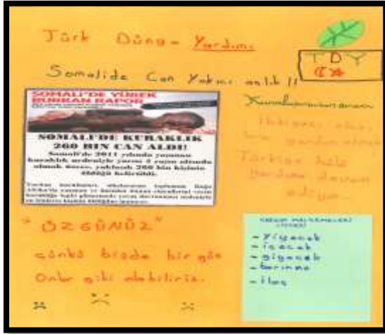
Resim 3: Grup 7'nin hazırladığı etkinlik ürünü

Grup 7'ye de haber kartı seçimi yapıldıktan hemen sonra gruba bu haber kartını seçme gerekçeleri sorulmuştur. Grup 7 sözcüsü ise, 'diğer haberlerdeki ülkelerin daha zengin olduğunu ancak Somali'deki çocukların yiyecek bulamayacak kadar fakir olduğunu' düşündükleri için bu ülkeye yardım etmek istediklerini belirtmişlerdir. Grup 7'nin etkinlik kapsamında hazırladığı yardım mektubu incelendiğinde, kendilerine kuruluş ismi olarak 'TDY (Türk Dünya Yardımı)' ismini vermişlerdir. Ayrıca bu isme uygun olarak bir de amblem tasarımı yapmışlardır. Yardıma muhtaç kişiler için kurulan TDY'nin yardım malzemesi listelerinde gıda, giyecek, barınma ve ilaç bulunmaktadır. Diğer gruplardan farklı olarak Grup 7 çalışmalarında, bir gün onlarla aynı durumda kalabileceklerinin altını çizmişler ve ülkeye karşı daha duyarlı yaklaşılması gerektiğine dikkati çekmişlerdir. Bilindiği üzere empati iletişimin güçlenmesine, ilişkilerin artmasına ve problemlerin kısa zamanda çözüm bulmasına yardımcı olmaktadır. Bu bağlamda öğrencilerin Somali halkıyla kendilerini özdeşleştirmeleri, ülkenin sorunlarına karşı daha hızlı çözüm bulmada itici bir güç sağlamak ve daha fazla insanın, soruna karşı sağduyuyla yaklaşmalarını teşvik edebilmektedir.