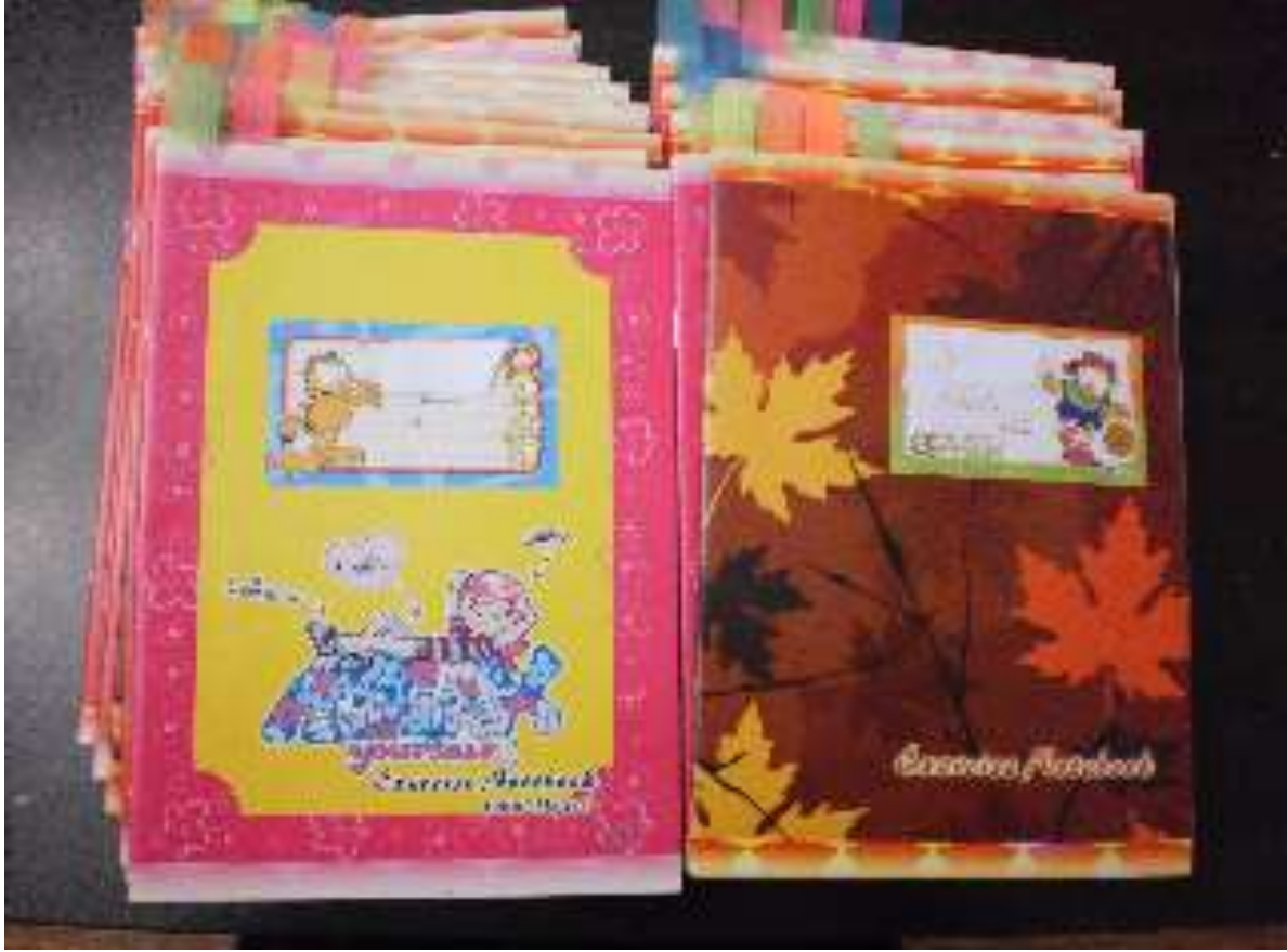
Şekil 2. Kavramlara Göre Sayfaları Renkli Yapışkanlarla Kodlanmış Öğrencilerin Tuttuğu Günlükler

Şekil 2'de araştırmacı öğretmen tarafından, verilerin incelenmesi ve çözümlenmesi sürecinde kavramlara göre sayfaları renkli yapışkanlarla kodlanmış öğrencilerin tuttuğu günlüklerin toplu çekilmiş bir resmi gösterilmiştir.