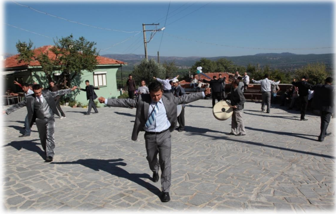
Fotoğraf 3. ‘Damat Oynatma’, Yukarıcuma köyü-Bergama (11.10.2009).