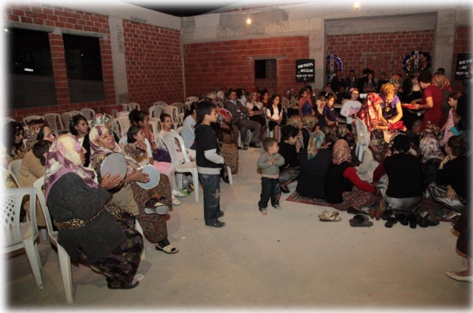
Fotoğraf 2. 'Kına Yakma', Yukarıcuma köyü-Bergama (10.10.2009).

Oğlan evinden erkek müzisyenler eşliğinde yola çıkartılan kına, tören alanına ulaştığında bu liminal rehberler tarafından devralınır. Gelin evinden çıkarak kına töreninin yapılacağı alana onlar eşliğinde gelir; üç kez daire çizdikten (kına dönme) sonra kendisine gösterilen yere oturur ve eline kına yakılarak ağlatılır (Resim 2). Dümbekçiler, ayrılığı vurgulayan sözleriyle yöreye özgü kına havası 'Aştı Caim'i seslendirmeye başlarlar ve bu aşamada genellikle başka bir havaya yer vermezler. Gelinin avucu içine yerleştirilen ve sembolik 16 olarak yakılan kına, komünitesin hazır bulunan kadın üyelerine de hediye olarak dağıtılır.