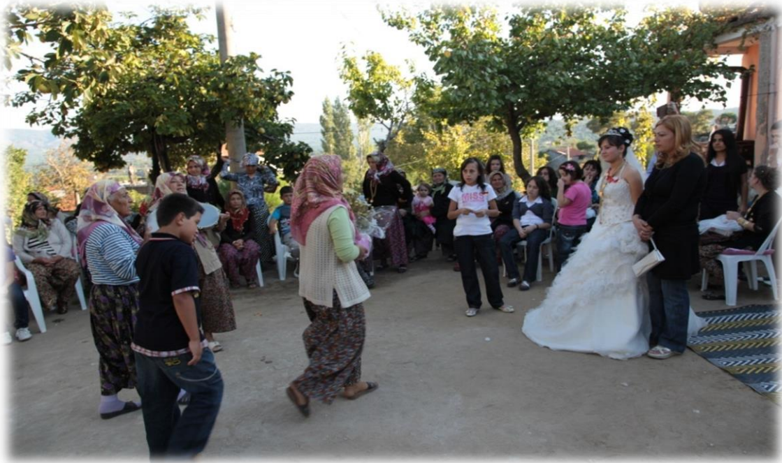
Fotoğraf 4. 'Kardeş Kavuşma', Yukarıcuma köyü-Bergama (11.10.2009)

Yaşanacak olan fiziksel bir ayrılık olmayabilir, gelin yine kendi köyünde kalabilir. Ancak evlenmeden önce kurduğu arkadaşlık ve dostluk bağları mutlaka biçim değiştirecek, evli bir eş olarak eski arkadaşlarıyla görüşme ve sosyalleşme biçimleri yeniden düzenlenecektir. Bu nedenle ritüelin bu son günü, vedalaşmak için seçtiği kişilerin kimler olduğu önem taşır. Evlendikten sonra devam ettireceği sosyal ilişkiler içinde bu kişilerin ayrı bir yeri olacak ve onlar belki de bu sosyal düzenlemelerden belirli derecede muaf tutulacaklardır. Turner (1967:10) bu gibi küçük liminal grupların bir yoldaşlar topluluğu olduğunu ve bu evrede kurulan ilişkilerin statü, yaş, akrabalık derecesi hatta cinsiyet gibi farkları bile aşabilen uzun erimli dostluklara dönüşerek, toplumsal hiyerarşi ve akrabalık bağları dışında oluşan bu türden özel bağların, hayat boyu devam etmesinin beklendiğini hatırlatır.