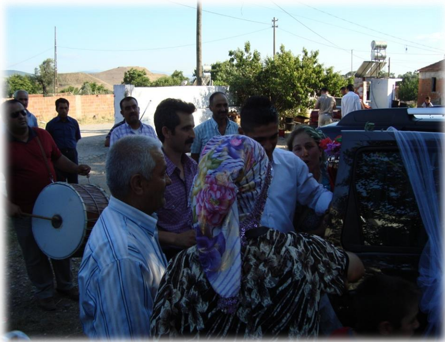
Fotoğraf 5. ‘Gelin İndirme’, Narlıca Köyü-Bergama (26.06.2011).

Gelin ve damadın bu fiziksel eşiği geçerek yeni toplumsal mekânlarına girmelerinin ardından, geçiş rehberlik etmek amacıyla ritüele katılan Roman müzisyenler köyden ayrılır ve komünitâs dağılır. Ancak geçiş yine de henüz tamamlanmamıştır. Geçişin komünitâs nezdinde tamamlandığının göstergesi; ‘gerdek’ sonrası, birleşmenin biyolojik olarak da sorunsuzca tamamlandığına ilişkin gelecek haberler doğrultusunda, ‘post-liminal’ olarak adlandırılan yeni bir evreye geçilmesi olacaktır. Ritüel öznelerinin biyolojik olarak birleşmeleri/bütünleşmeleri ile başlayan bu evre, herhangi bir müziksel boyut taşımayan, komünitâs sonrası toplumsal birleşme törenleri ile devam eder. Adayların yeni toplumsal kimlikleri ile bütünleştikleri bu aşamalar, Gennepe’in ‘birleşme ayinleri’ ( rites of incorporation ) adını verdiği süreçle örtüşür.