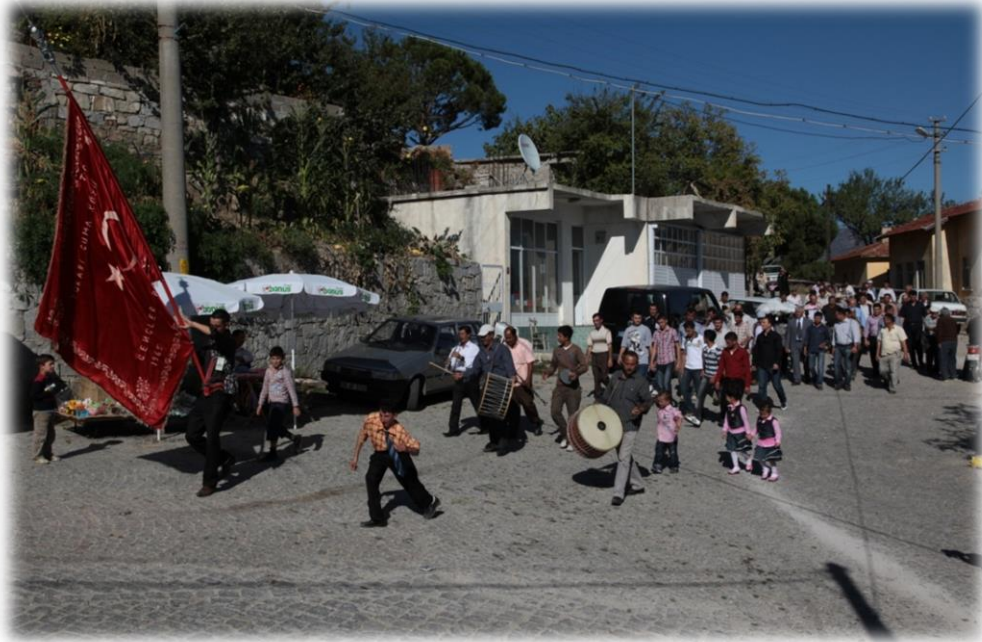
Fotoğraf 1. Çeyiz götürme, Yukarıcuma köyü-Bergama (10.10.2009).

Gelinliğin kız evine gelmesi, artık ayrılık vaktinin yaklaştığı anlamını taşır ve dümbekçiler bu ayrılık atmosferini Bergama çevresine özgü kına havası 'Aştı Caim'i ve benzeri ayrılık temalı havaları söyleyerek pekiştirirler. Çeyizin teslim alınmasının hemen ardından bayrak töreni tekrarlanarak sancak toplanır. Davul-zurna-sancak 14 üçlüsünün geçmişten beri hem 'millî' birlik ve bütünlüğün hem de yerel aidiyetin bir simgesi olması ve kutsal kabul edilmesi; tıpkı sünnet düğünleri ve asker uğurlamaları gibi evlilik ritüellerini de kutsayan ve manevî değerlerle ilişkilendiren anlamlar açığa çıkarır. Roman müzisyenlerin bu bağlamdaki icraları açıkça yerel ve bölgesel olanın ötesine geçer ve tüm komünite üyelerinin kendilerini çok daha büyük bir bütünün parçası olarak hissetmelerine hizmet eder. Komünite içi dayanışmanın ve armağan ekonomisinin bir göstergesi olarak çeyizin asılması ve tüm davetlilere sergilenmesi de kimi köylerde yine müzik eşliğinde gerçekleştirilir.