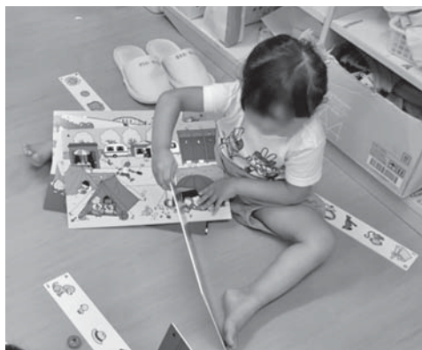
資料2 紙芝居に見立てて遊ぶ3歳児