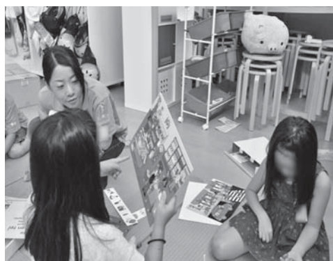
資料4 独自の遊び方を説明する女兒たち